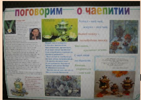
коллективные и индивидуальные проекты