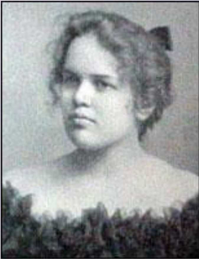
Adelaide Crapsey, creator of the American cinquain.