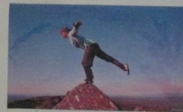
stieg auf die Berge