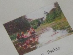
fuhr Boot fische