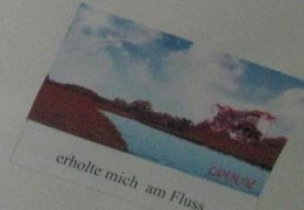
erholte mich am Fluss