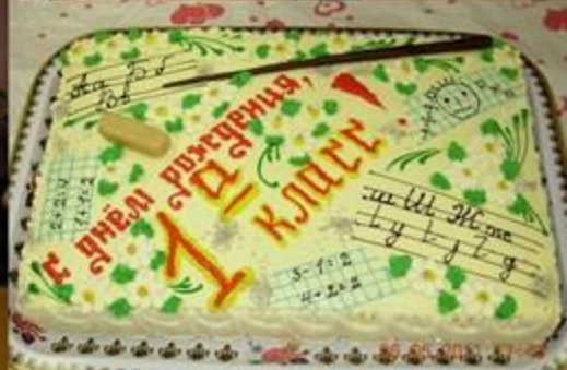
Наш общий День Рождения