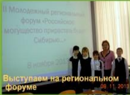
Выступаем на региональном форуме 09.11.2013