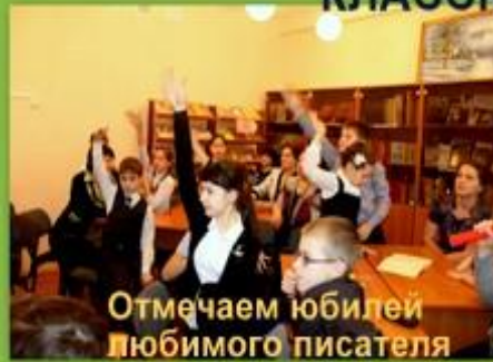
Отмечаем юбилей любимого писателя