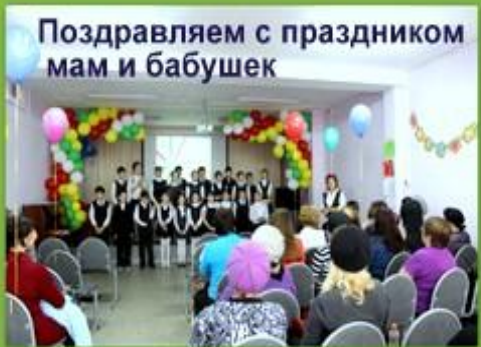
Поздравляем с праздником мам и бабушек