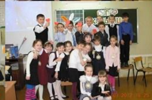
Супер Школьница -2012