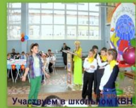
Участвуем в школьном КВН