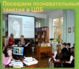
Посещаем познавательные занятия в ЦДБ