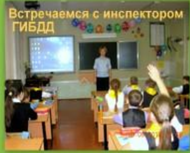
Встречаемся с инспектором ГИБДД