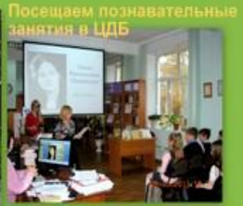
Посещаем познавательные занятия в ЦДБ