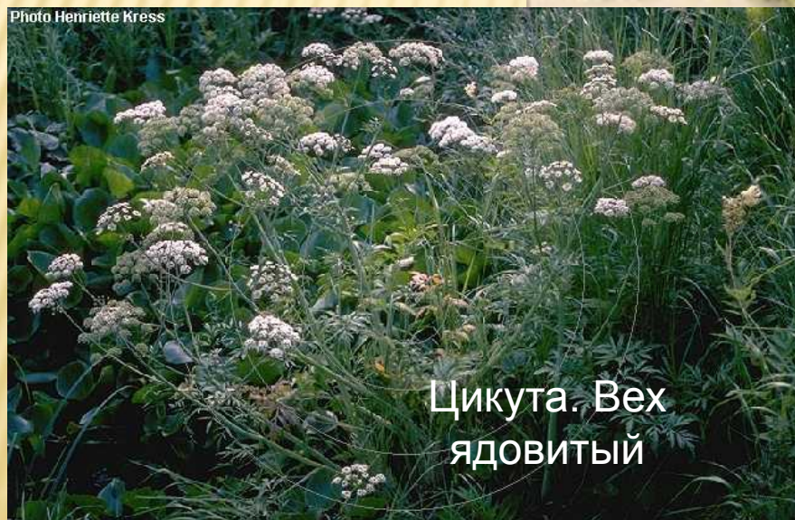
Цикута. Вех ЯДОВИТЫЙ