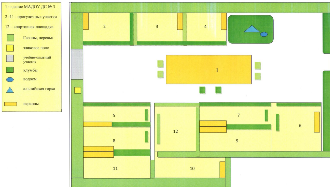
План-схема озеленения территории МАДОУ ДС № 3