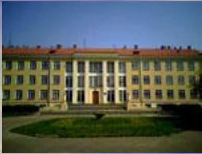
Институт физиологии имени И.П. Павлова РАН Колтуши

Среди личностных качеств , свойственных выдающимся ученым, обращают на себя внимание: