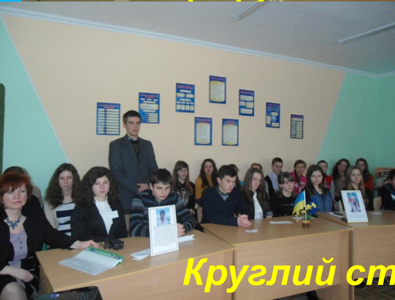
Круглий стіл в пам'ять Небесній