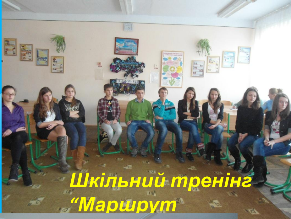
Шкільний тренінг "Маршрут"