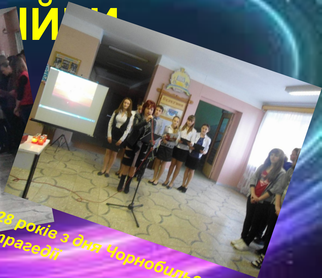
28 років з дня Чорнобильської трагедії