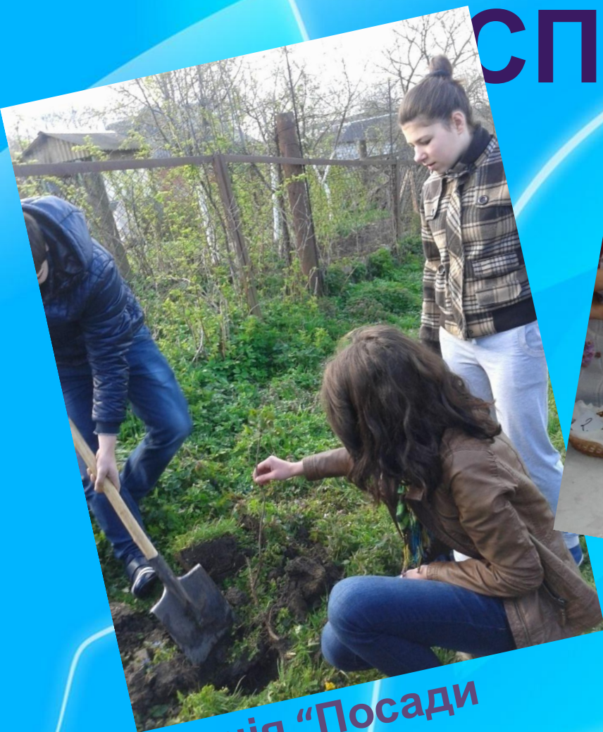
Акція "Посади деревце"