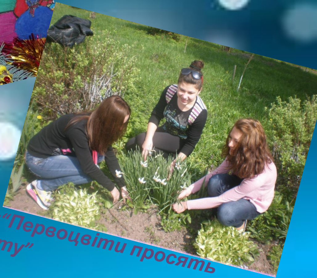
Акція "Первоцвіти просять захисту"