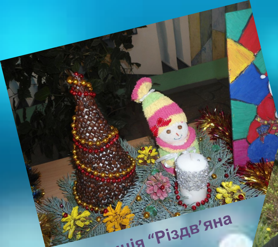
Композиція "Різдв'яна свічка"