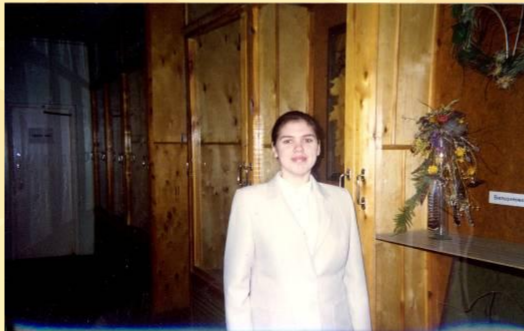
Выступление на Республиканской конференции «Шаг в будущее»