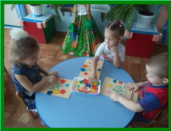
Д/и «Собери букет»