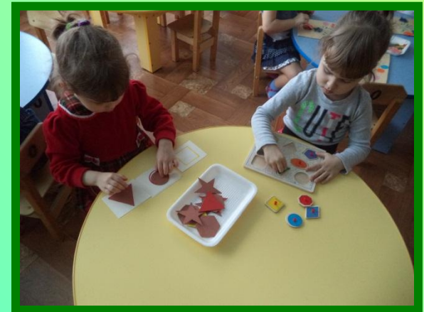
Д/И «Подбери по форме»