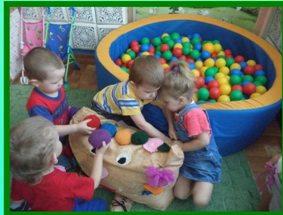
Наш друг «Шептунчик»