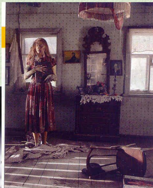
▲ «Чудо» Александра Прошкина — фильм о спасении души