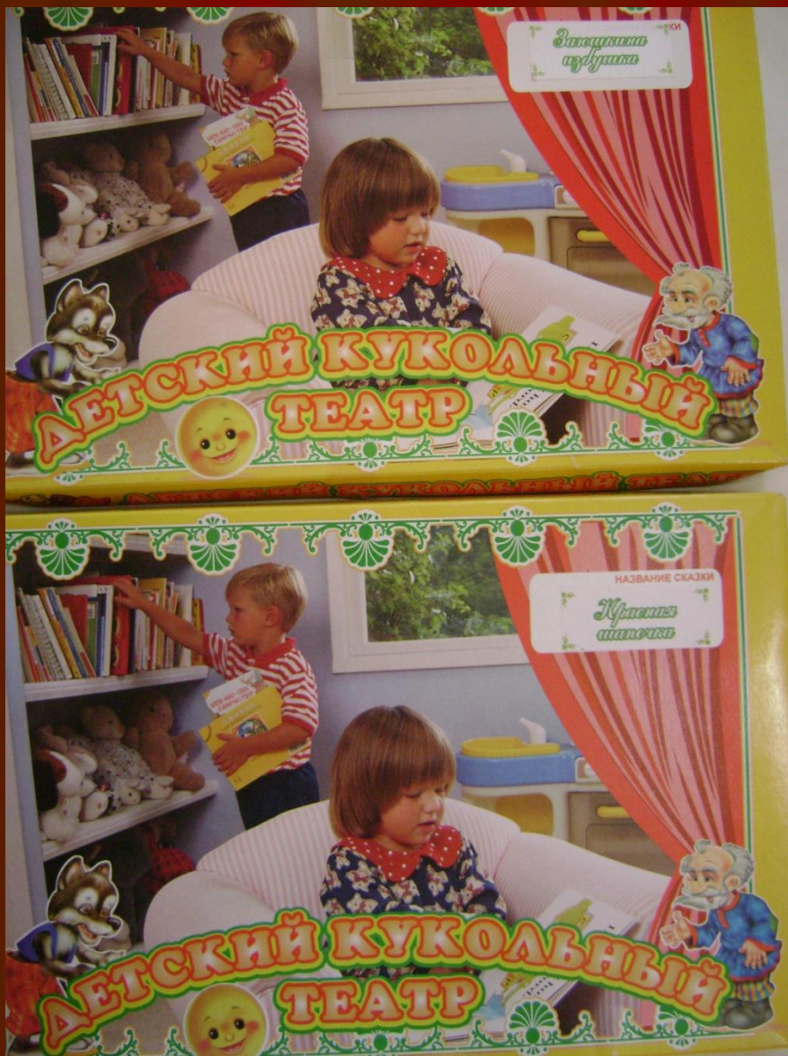
Настольный кукольный театр с ширмой.