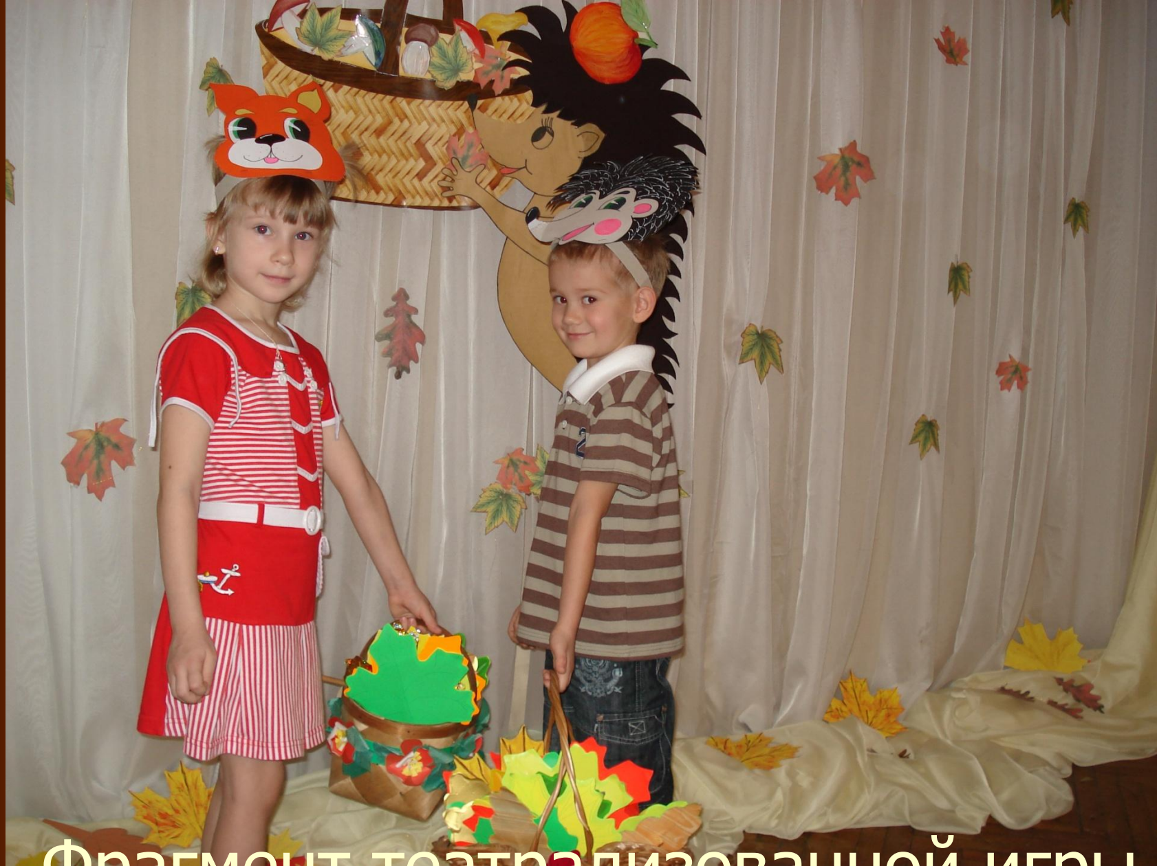
Фрагмент театрализованной игры «Весёлые зверята»