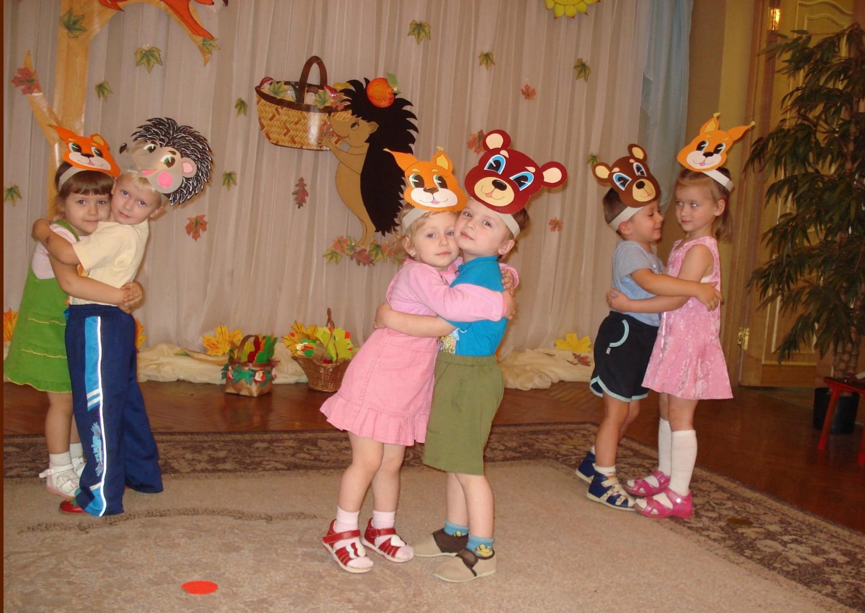
Фрагмент игры «Как подружились лесные зверята»