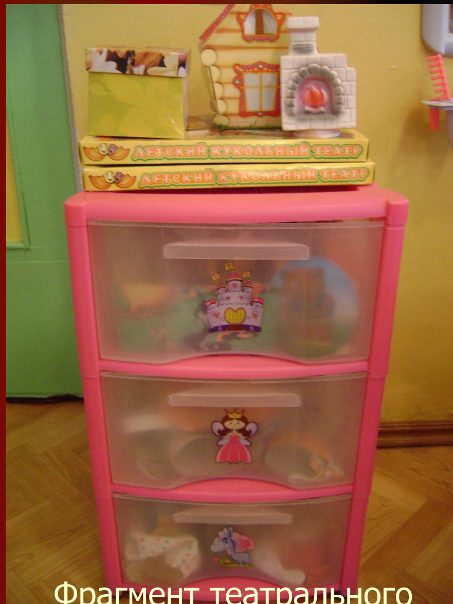
Фрагмент театрального уголка во 2 младшей группе.