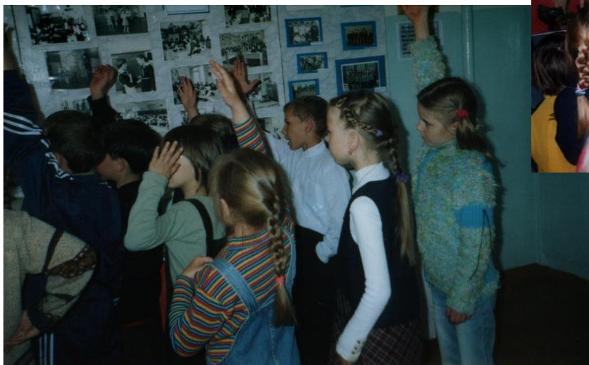
В школьном музее «Память»