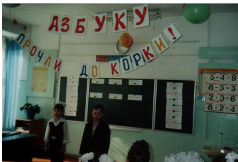
Прощание с Азбукой