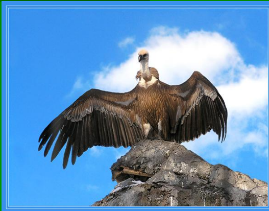
Гол как сокол

Например: мастер на все руки, не робкого десятка, цены нет, гол как сокол, легок на подъем, не от мира сего.