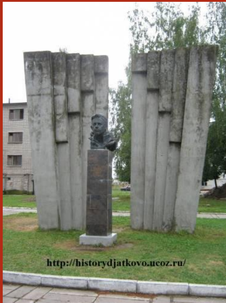
ПАМЯТНИК ГЕРОЮ СОВЕТСКОГО СОЮЗА ВЛАДИМИРУ САМСОНОВИЧУ РЯБКУ ПЕРЕД ДЯТЬКОВСКИМ ИНДУСТРИАЛЬНЫМ ТЕХНИКУМОМ