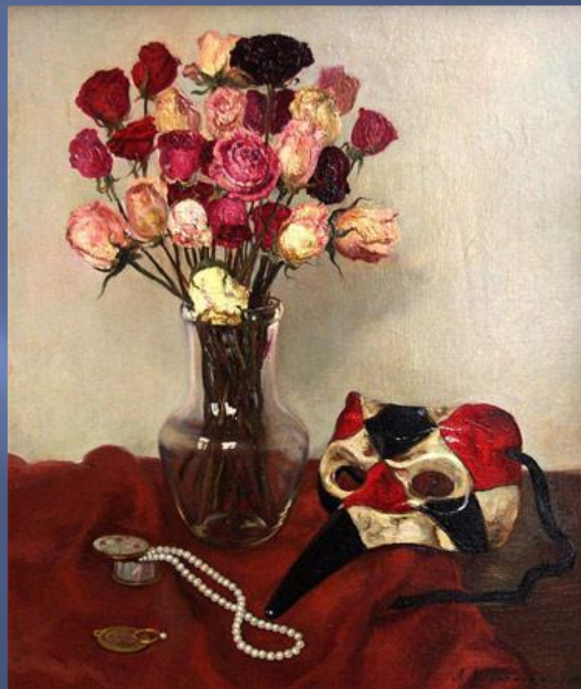
А. Ласкаржевская. Натюрморт с маской

Букет из красных гвоздик – Меня томит любовь к тебе.