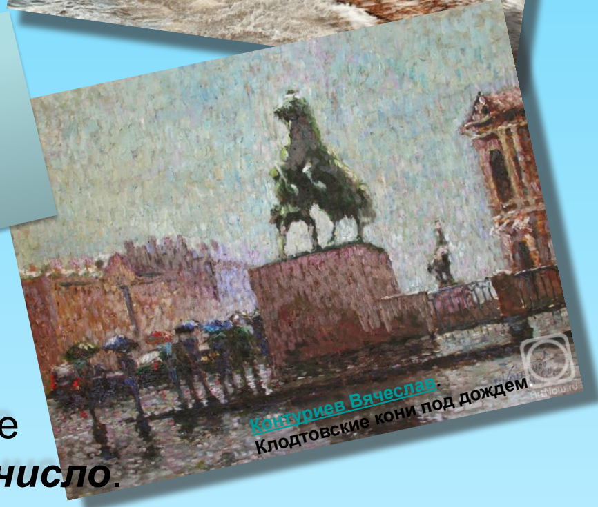
Конзуриев Вячеслав Клодтовские кони под дождем

Ну и ветер жмёт с залива! Дождик хлещет всё сильнее, И насквозь промокли гривы Старых клодтовских коней.