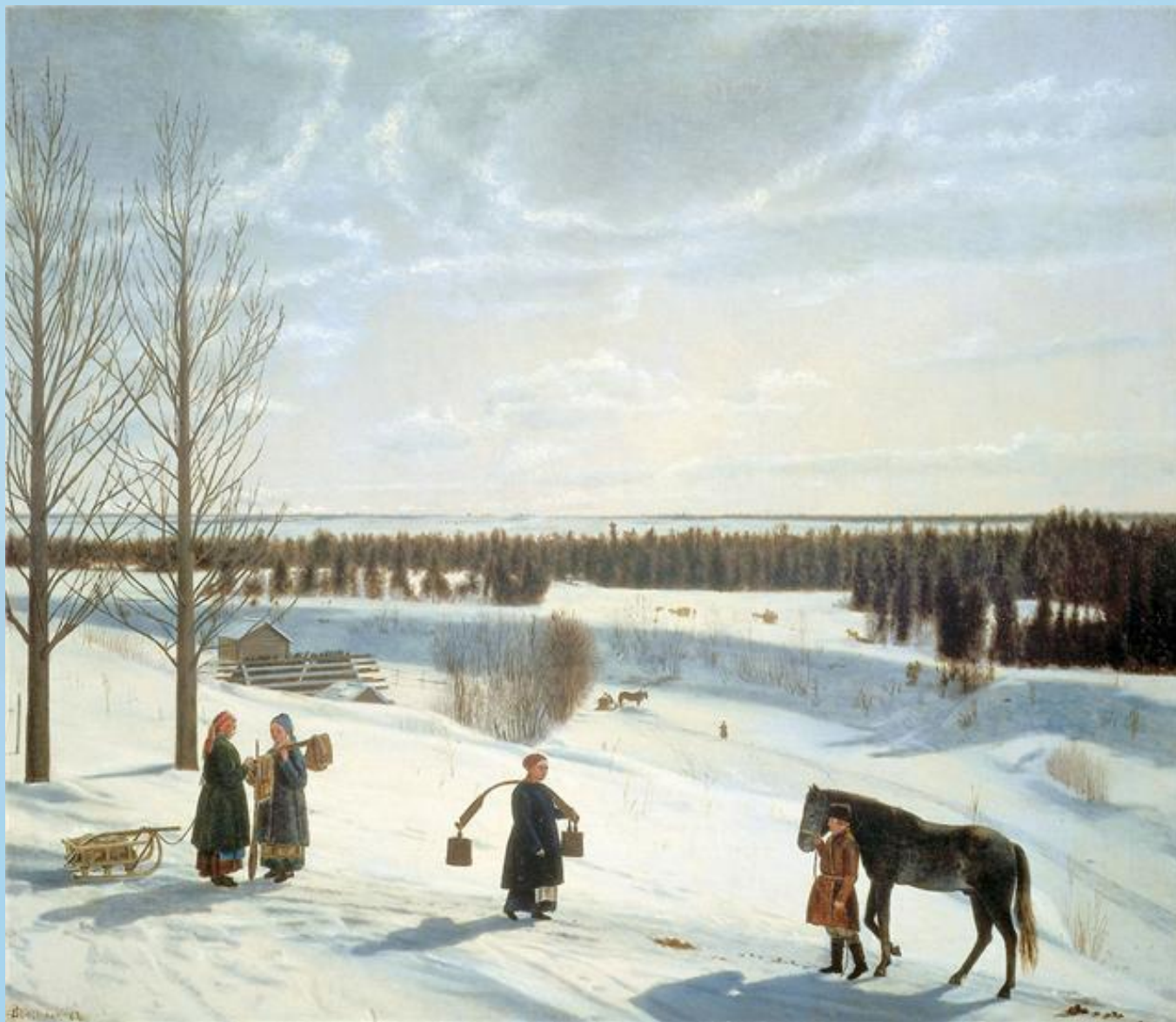
Коровин. Зимний пейзаж