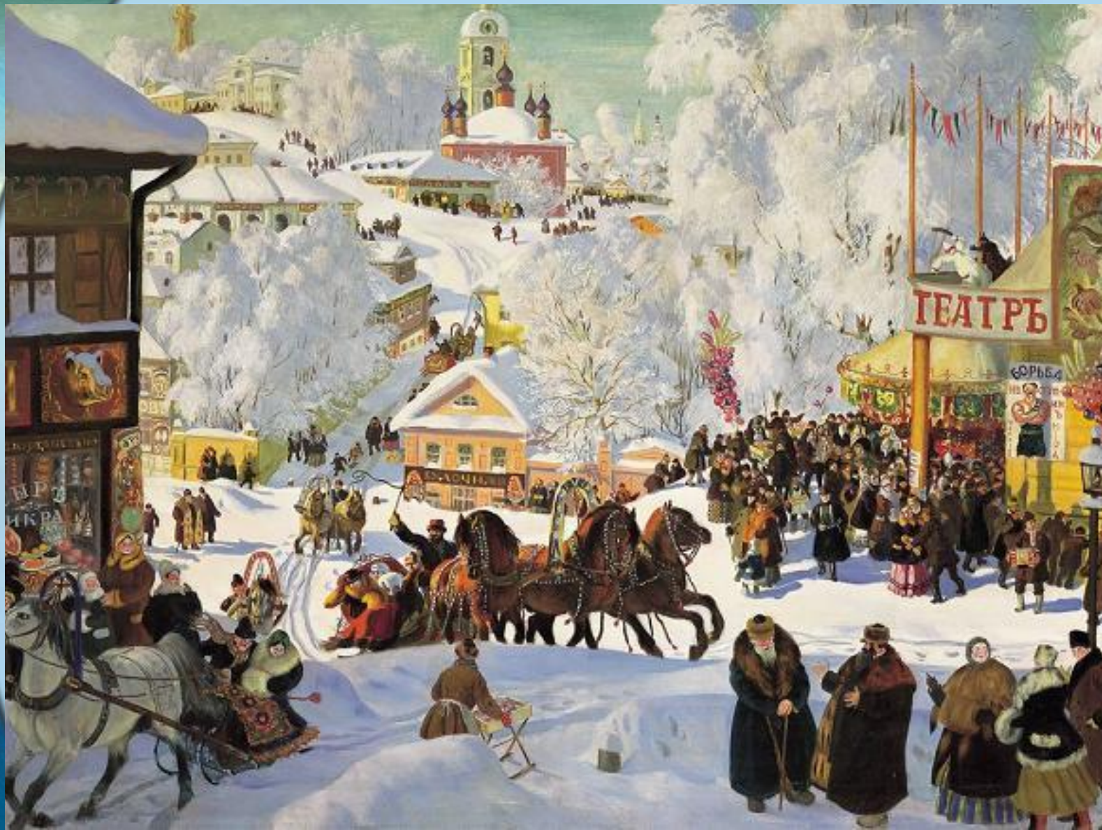
Кустодиев. Масленичное катание.