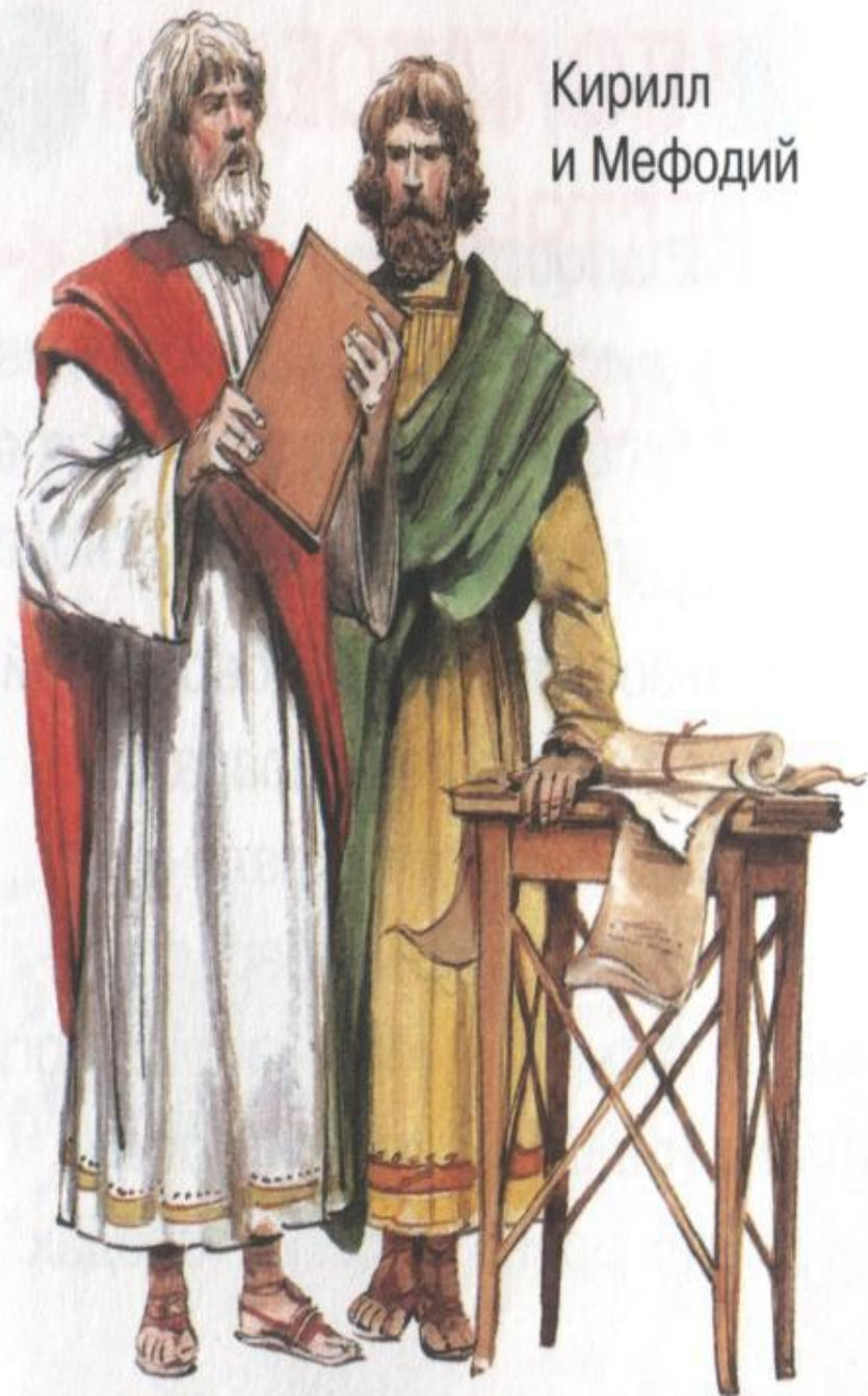
Кирилл и Мефодий