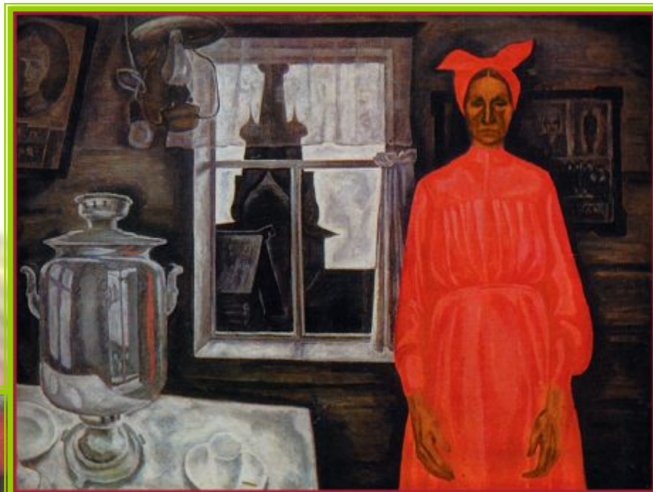
Одна. Худ. В.Е.Попков

«Север не терпит фальши, он весь на ладони»