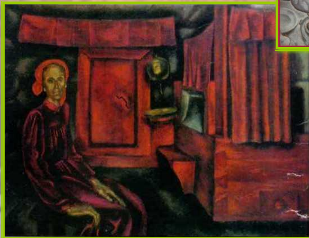
Старость. Худ. В.Е.Попков.