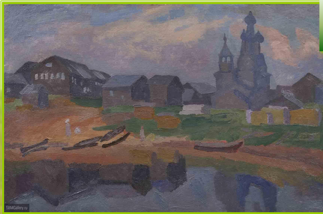
Деревня Кимжа. Худ. В.Е. Попков

«Стало ясно, что так просто от Мезени мне не уйти. Где-то самое дорогое в моей прошлой жизни живёт сейчас там... И на следующий год — опять я в тех краях, уже зная и предчувствуя, что мне нужно».