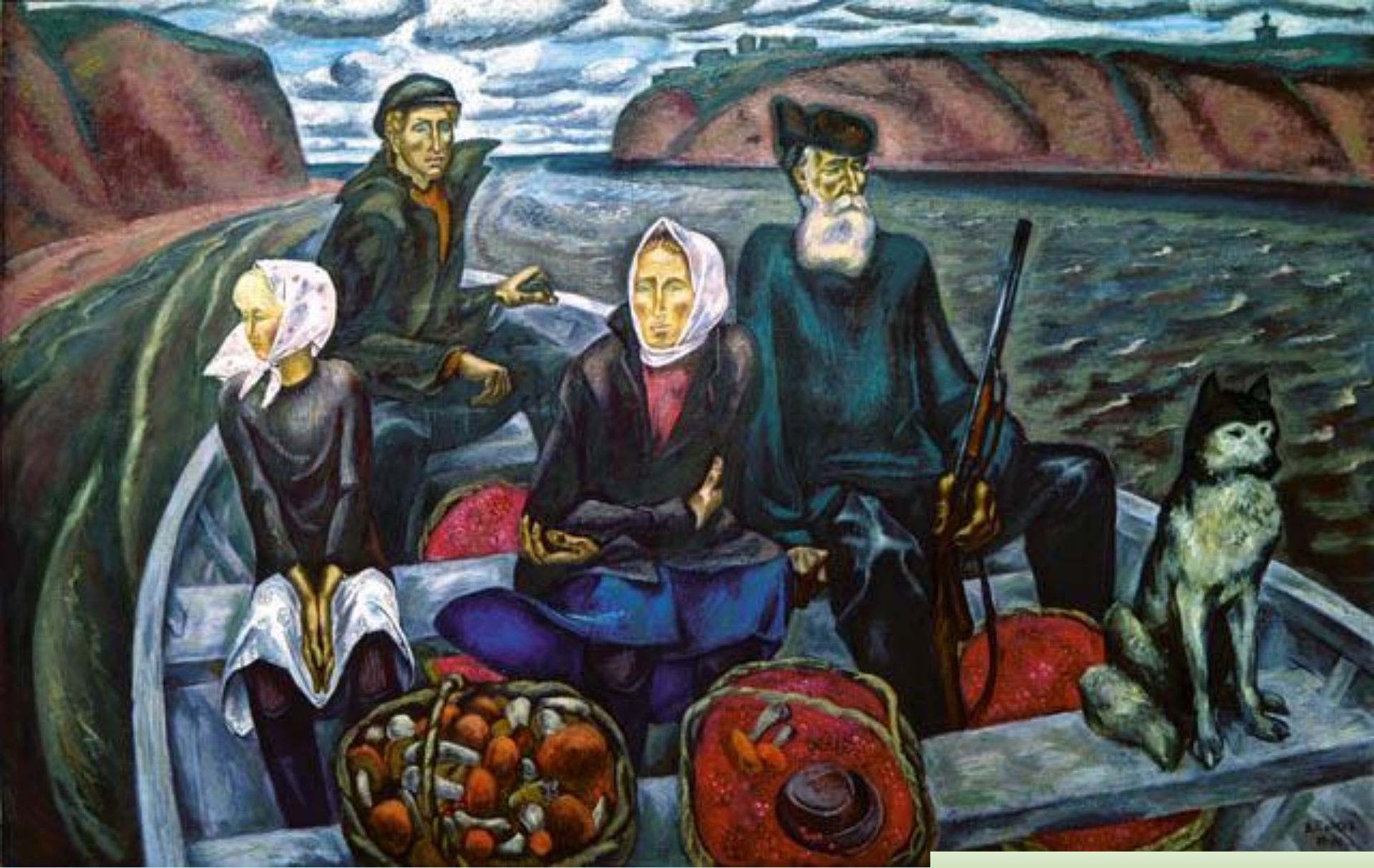
Сентябрь на Мезени. Худ. В.Е. Попков.