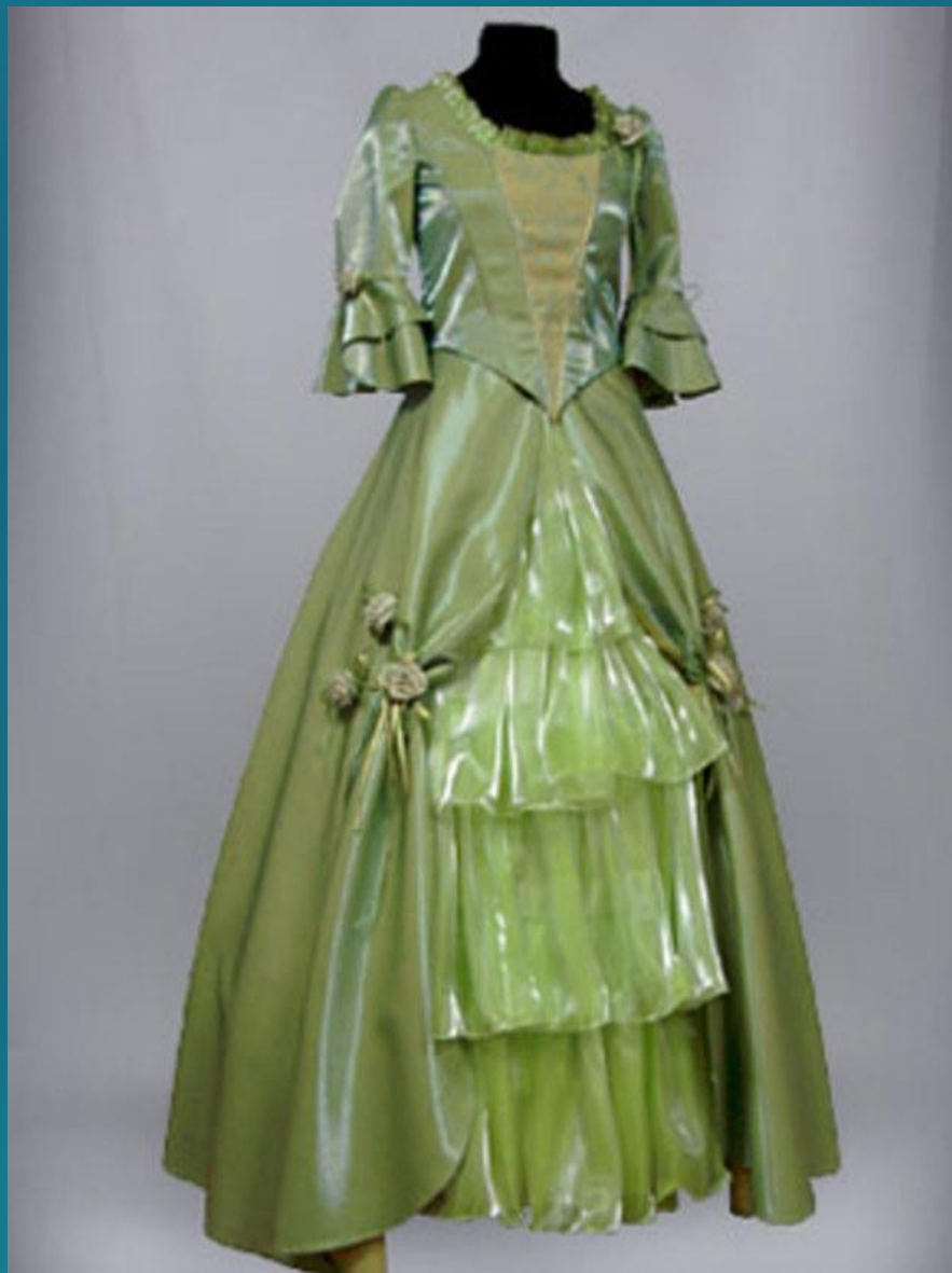
Старое платье - ...