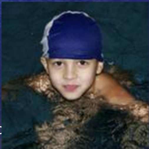
Бугр № 15, п. Саров