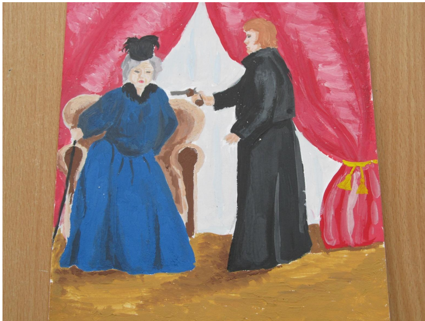
«Пиковая дама», автор: Астахова Елена