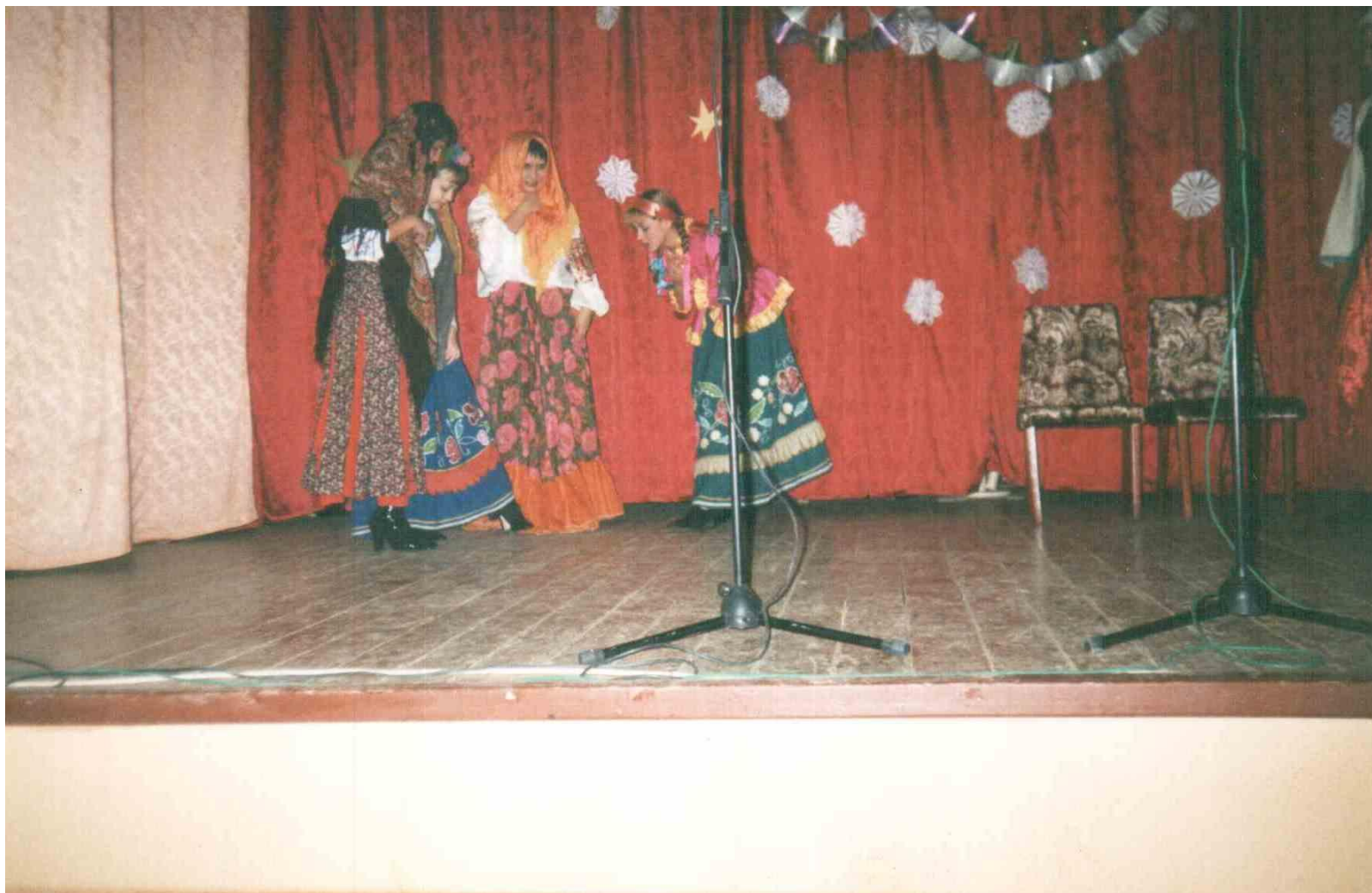
Школьный спектакль «Ночь перед Рождеством» «Одарка, у тебя новые черевички?»