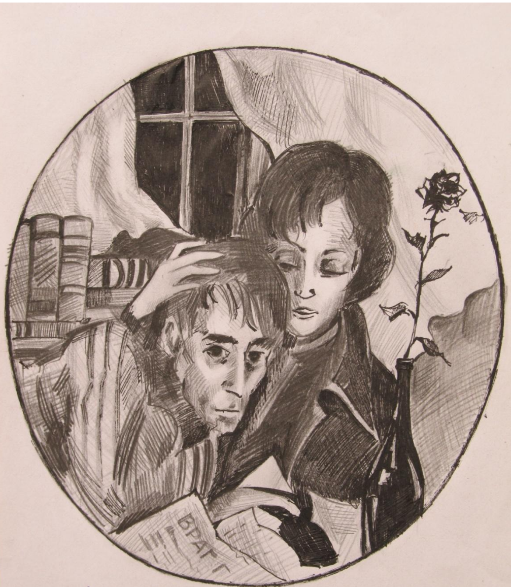
Мастер и Маргарита.