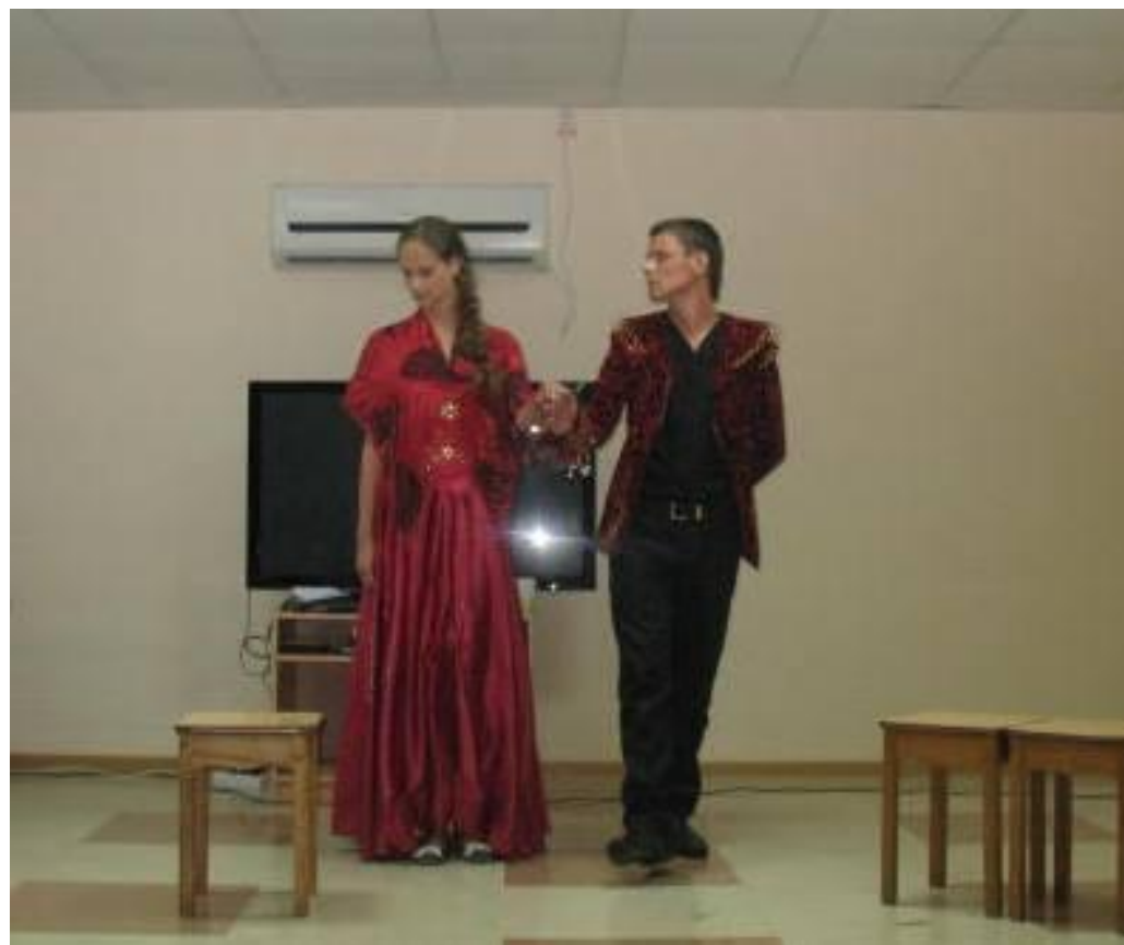
Спектакль «Повесть о Петре и Февронии Муромских»