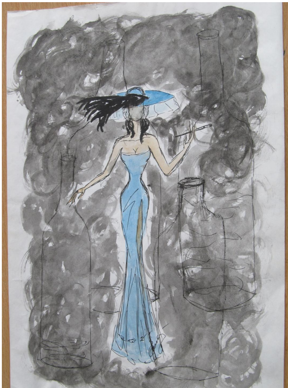
Портрет Незнакомки Автор: Астахова Елена