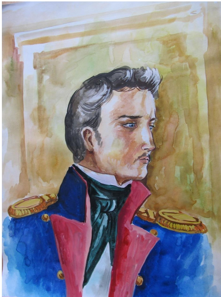
Портрет Печорина. Автор: Неткачева Вера