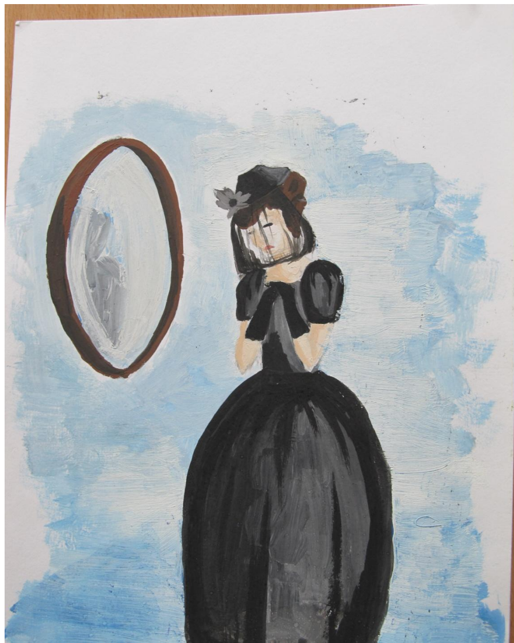
«Сжала руки под темной вуалью...» Автор: Астахова Елена