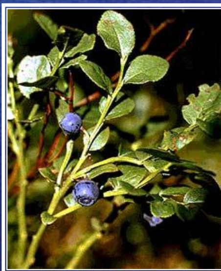
го л убика