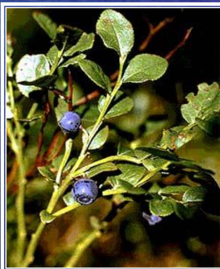
го л убика