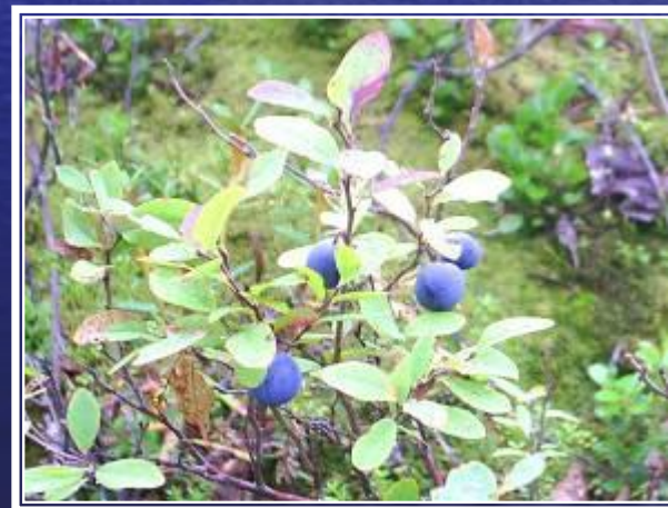
че р ника