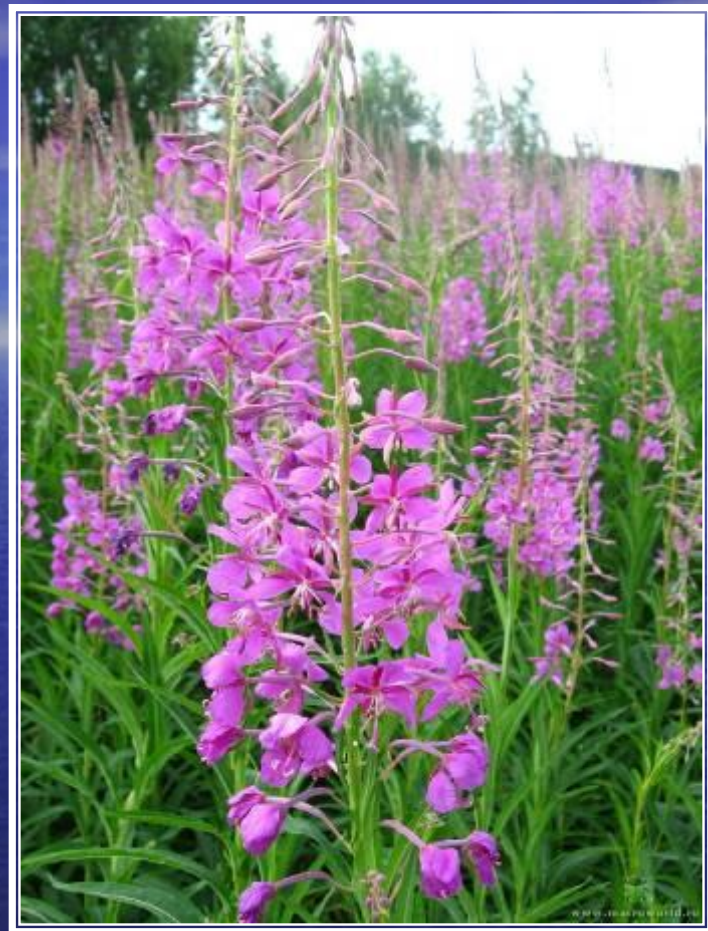
Иван – чай ( кипрей)