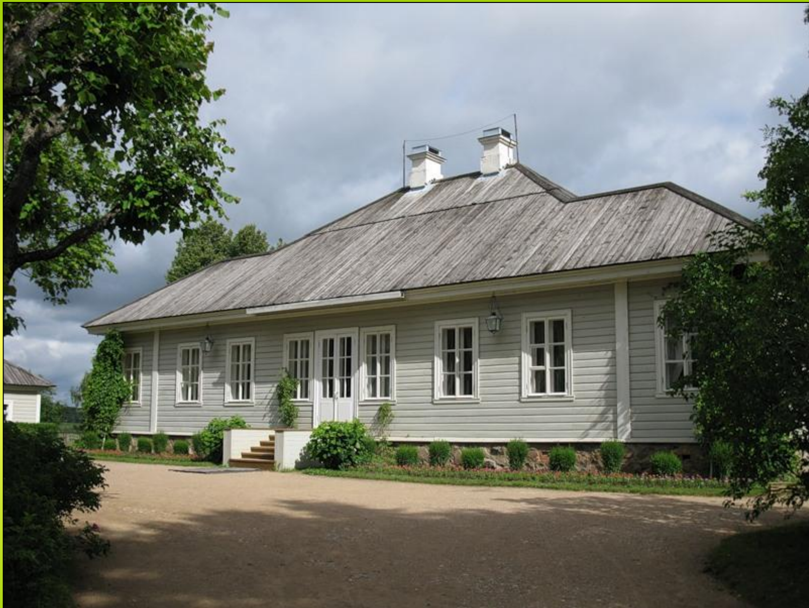
Дом-музей Пушкина 6