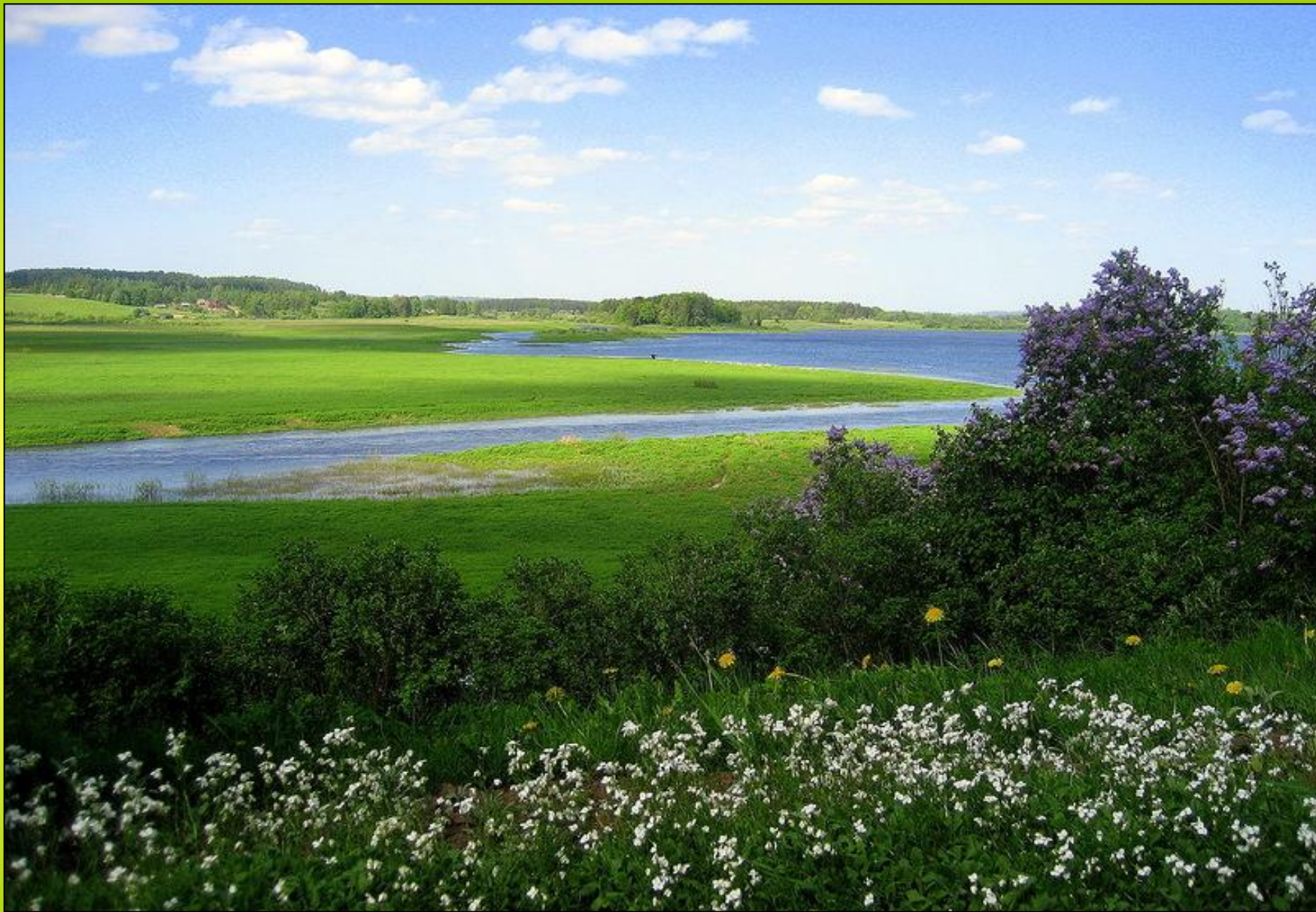
Псковские дали. Река Сорь 5