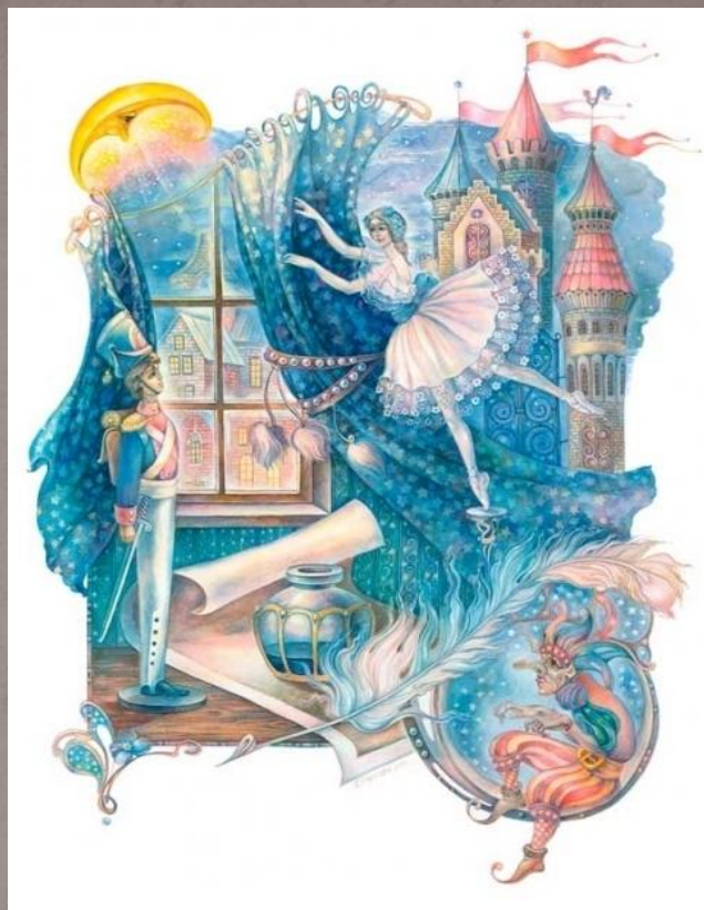
«Стойкий оловянный солдатик»