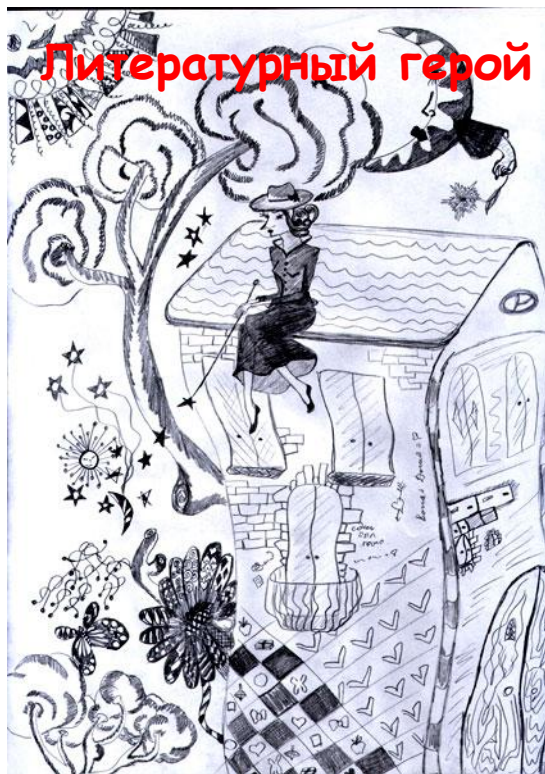
Цилиндр на пружинках