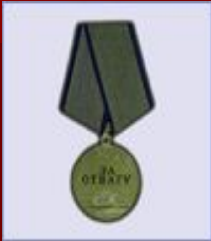
медаль "За Отвагу"