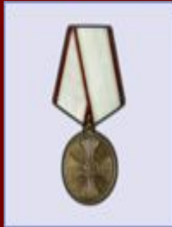
медаль "За спасение погибших"