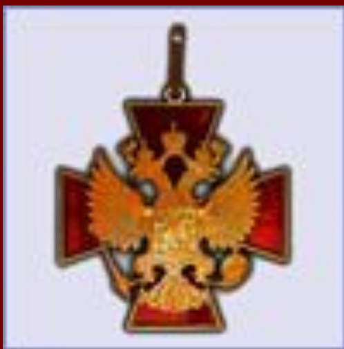
орден "За заслуги перед Отечеством"

Пожарное дело- для крепких парней, Пожарное дело- спасение людей, Пожарное дело-отвага и честь, Пожарное дело- так было и есть!