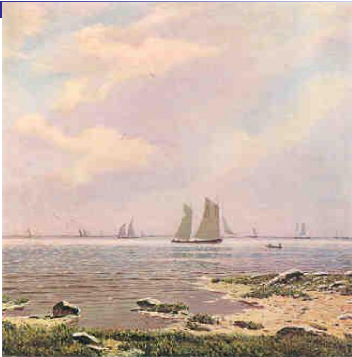
Н.Н. Дубовский. Море.