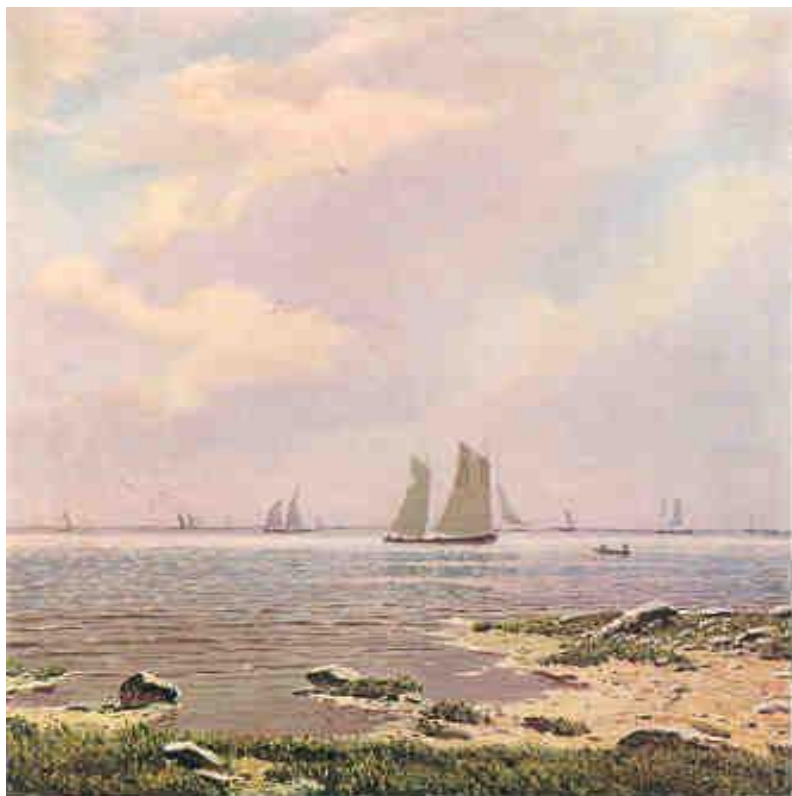
Н.Н. Дубовский. Море.