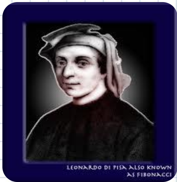
LEONARDO DE PISA ALSO KNOWN AS FIBONACCI