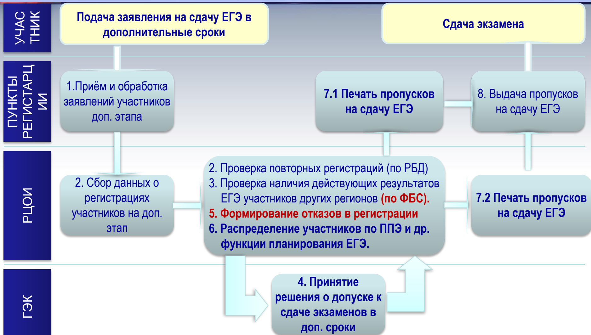
Схема регистрации участников и планирования проведения ЕГЭ в дополнительные сроки

Пункты регистрации участников дополнительного этапа могут создаваться на базе: