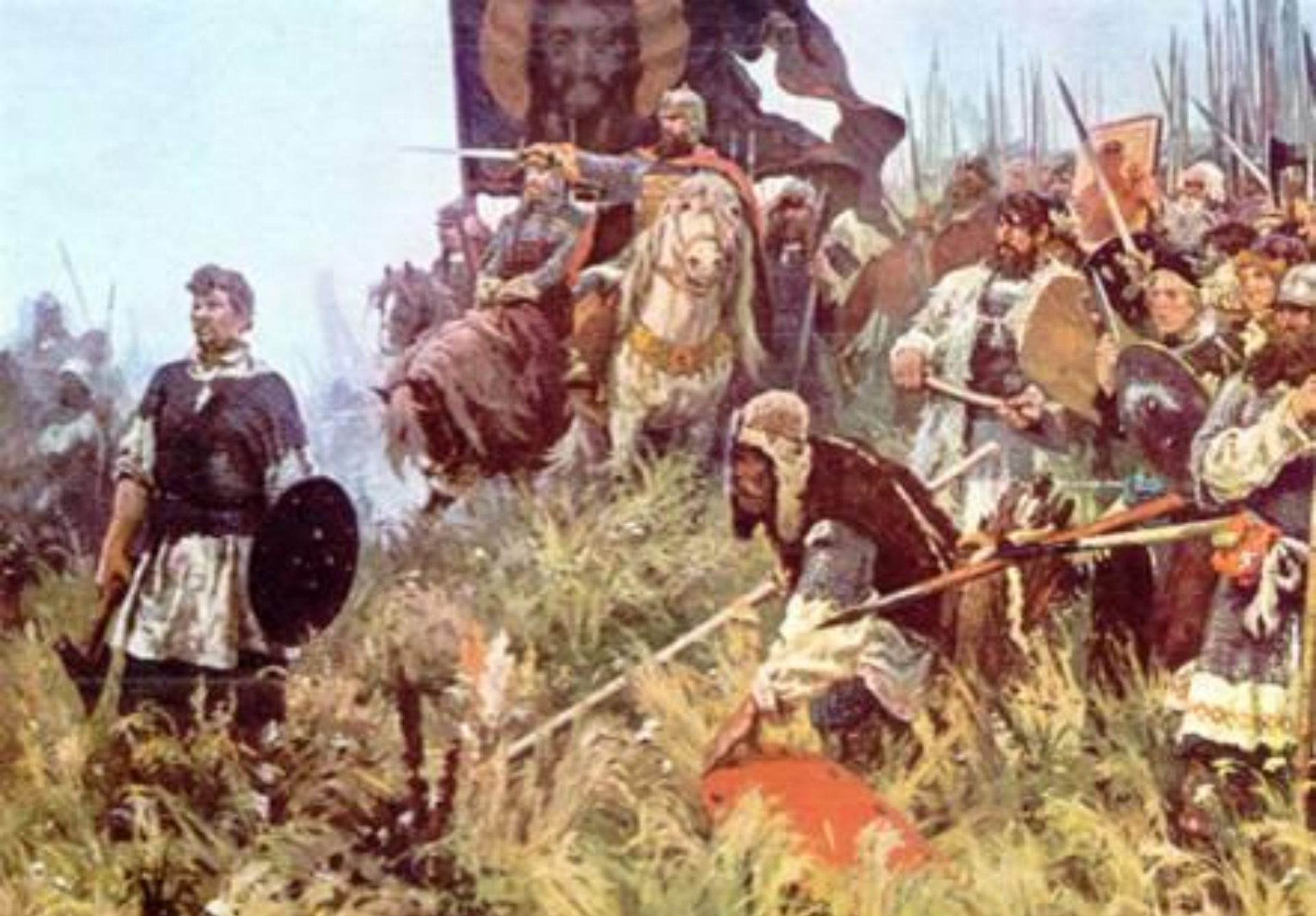
А.П. Бубнов. Утро на Куликовом поле.