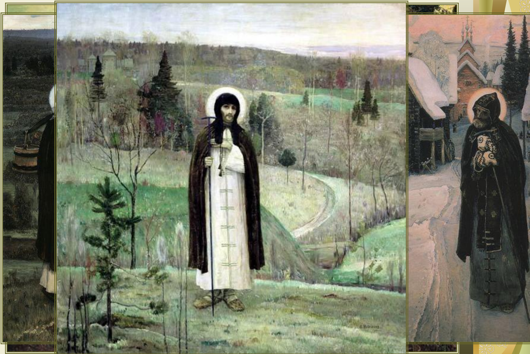
Н.В. Нестеров. Иудейский Стрилоу Бадор Бадраля.