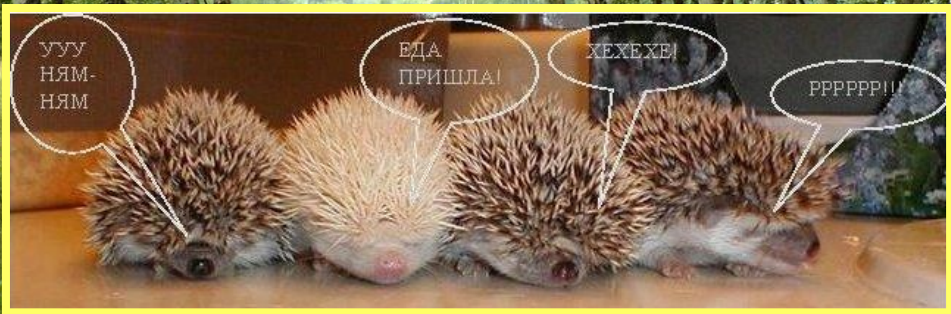
Ждут ежата гриб на ужин