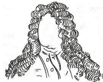
Парик «львиная грива». XVIII в.