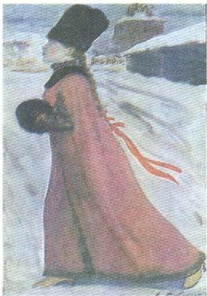
Московская девушка XVII в. Художник А. Рябушкин.