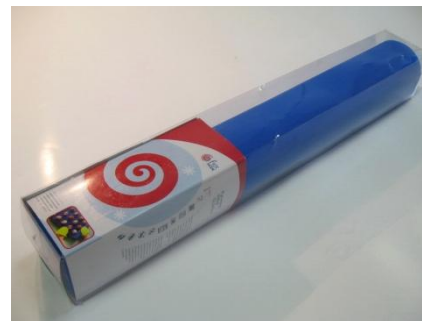
Коврик кулинарный 52,5 х42см