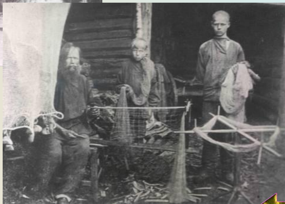
Вязание сетей. Заонежье. Начало XX в.