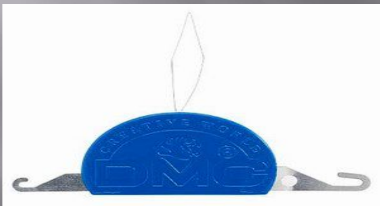
Универсальный нитковдеватель для быстрого вдевания нитки в иглу