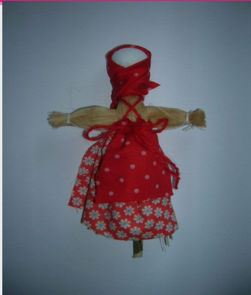
Домашняя масленица. Обрядовая кукла