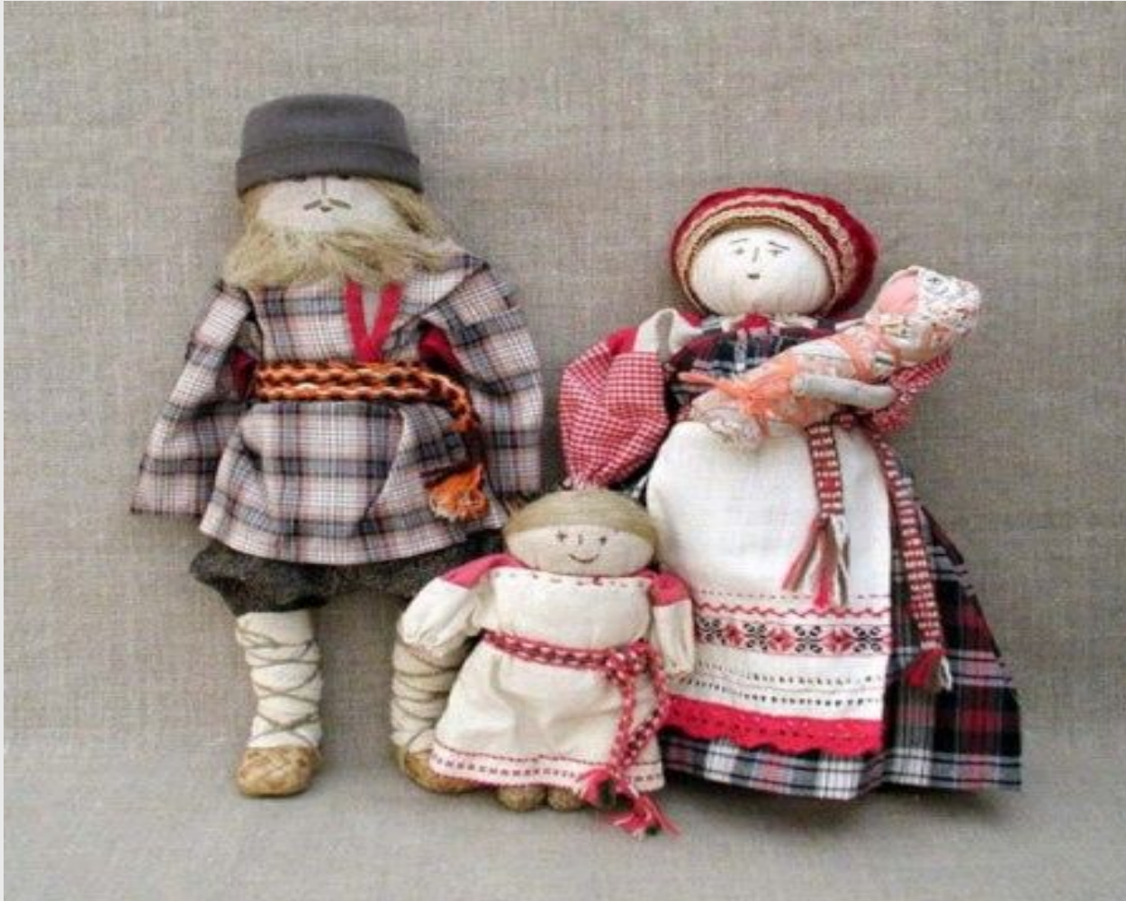
Русская игровая кукла.