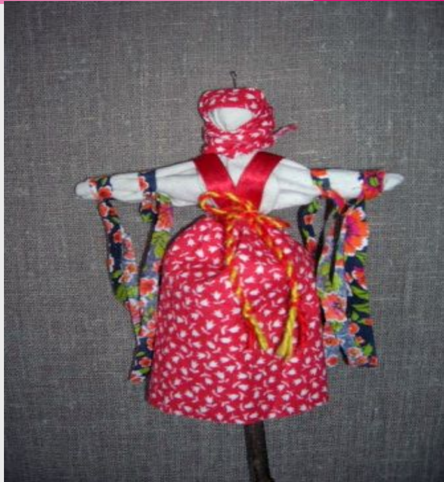
Купавка. Кукла одного дня. Уносит все беды и несчастья.