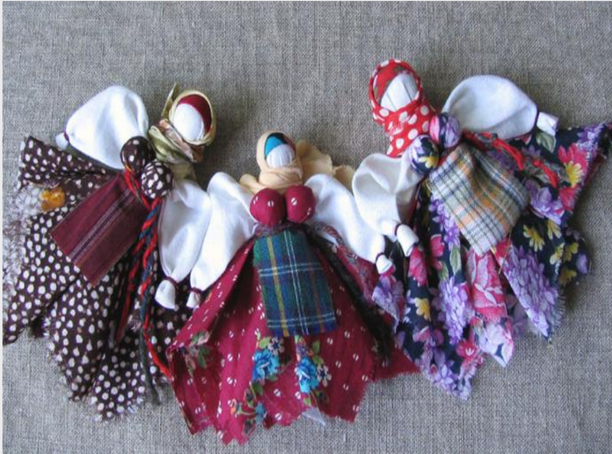
Кукла - зерновушка