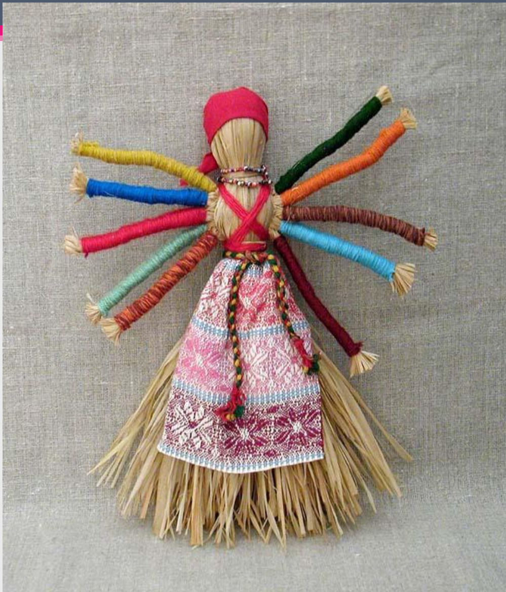
Кукла - десятиручка