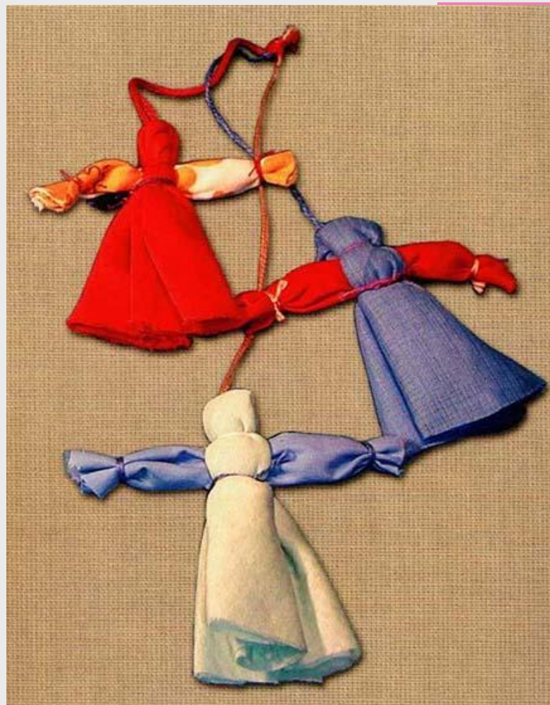
Самодельная кукла - кувадка.