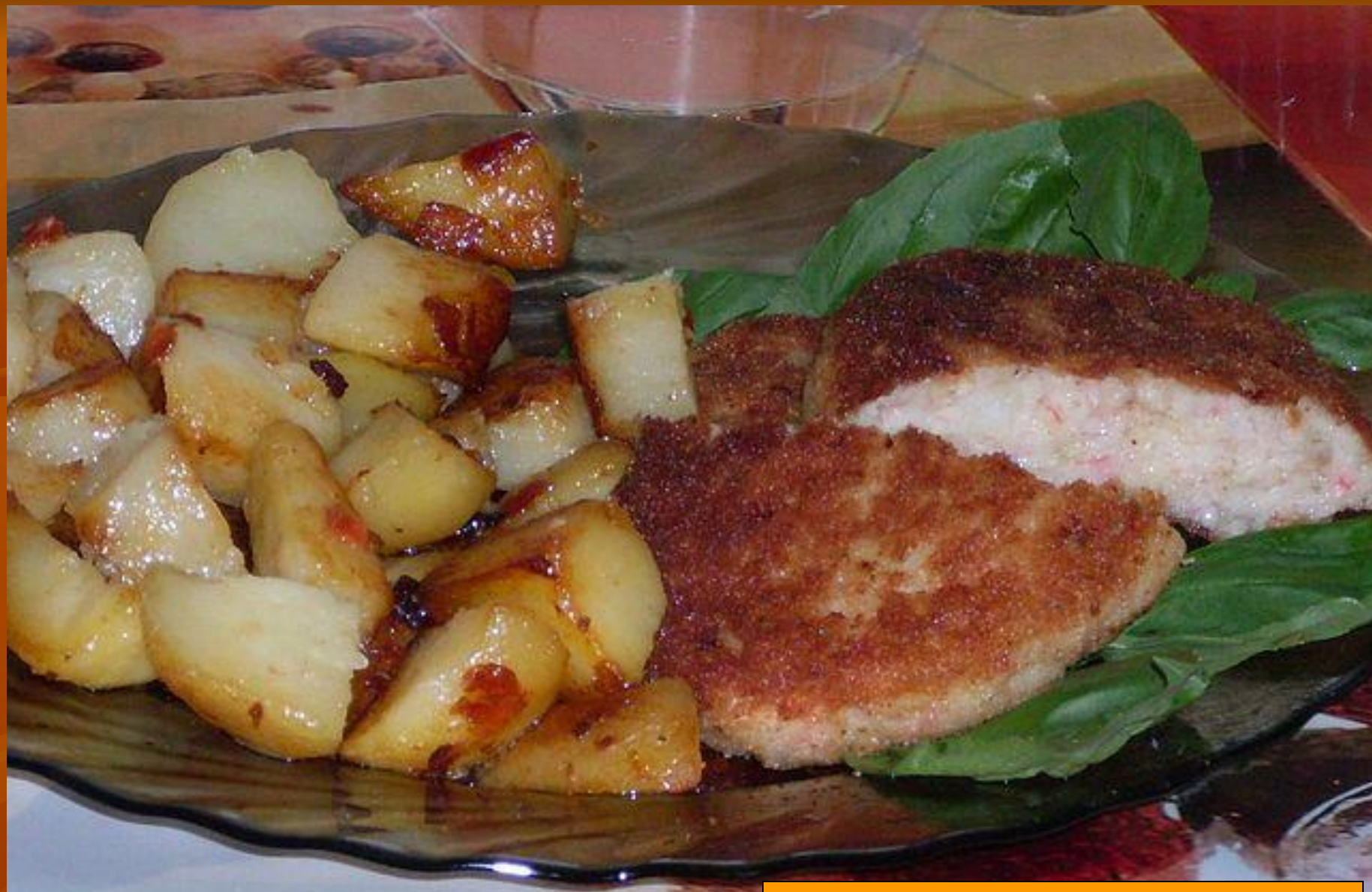
КОТЛЕТЫ ИЗ РЫБЫ