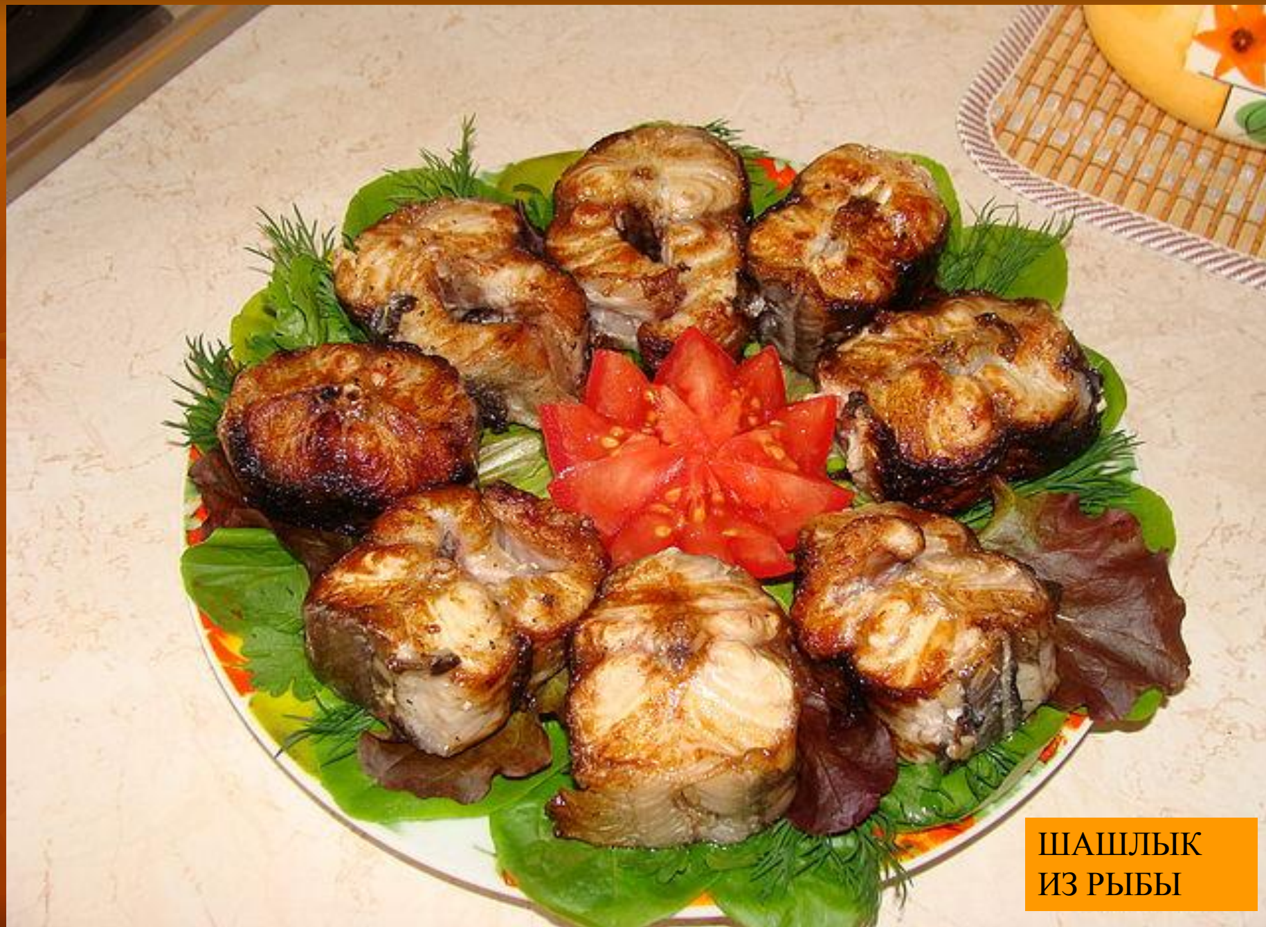
ШАШЛЫК ИЗ РЫБЫ