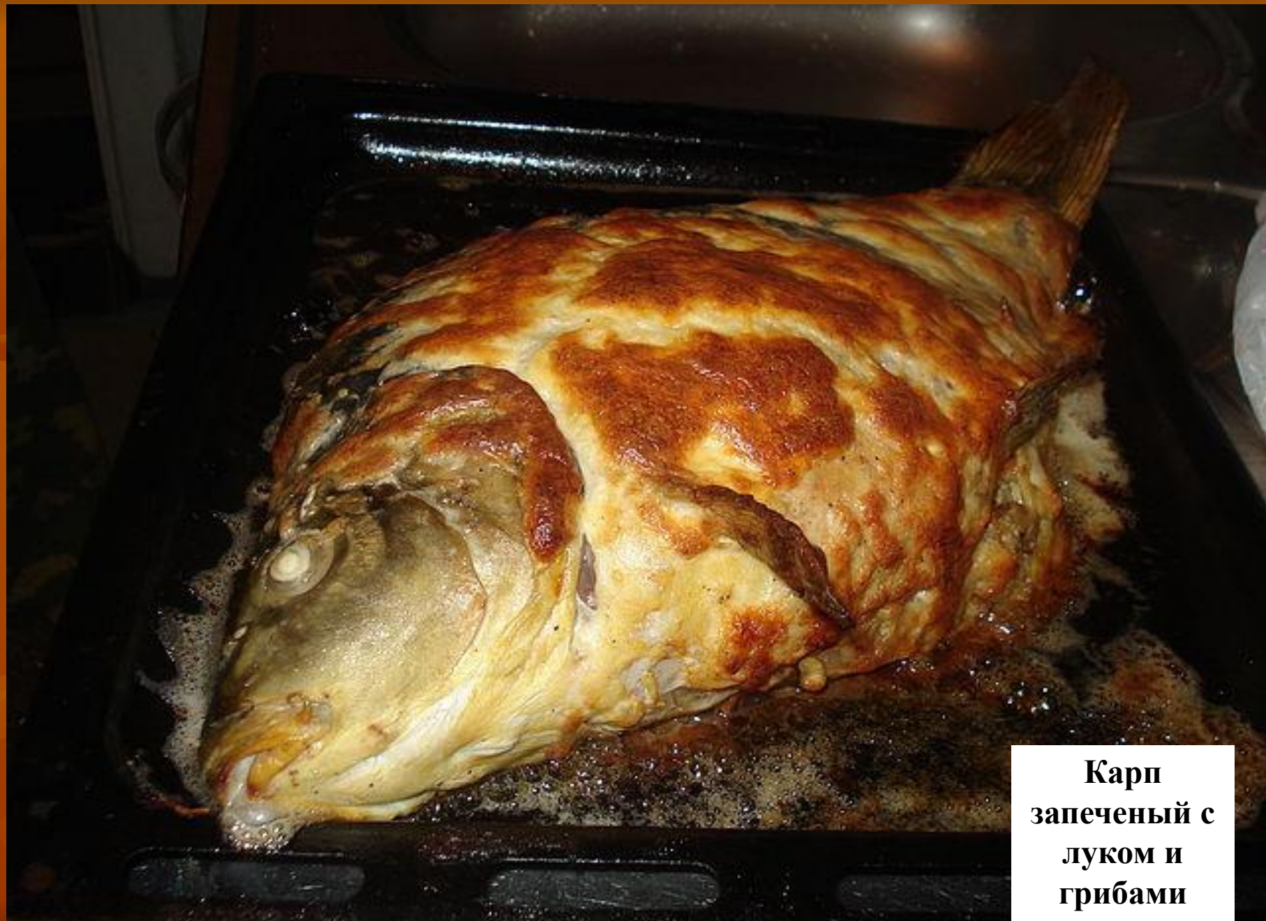
Карп запеченый с луком и грибами