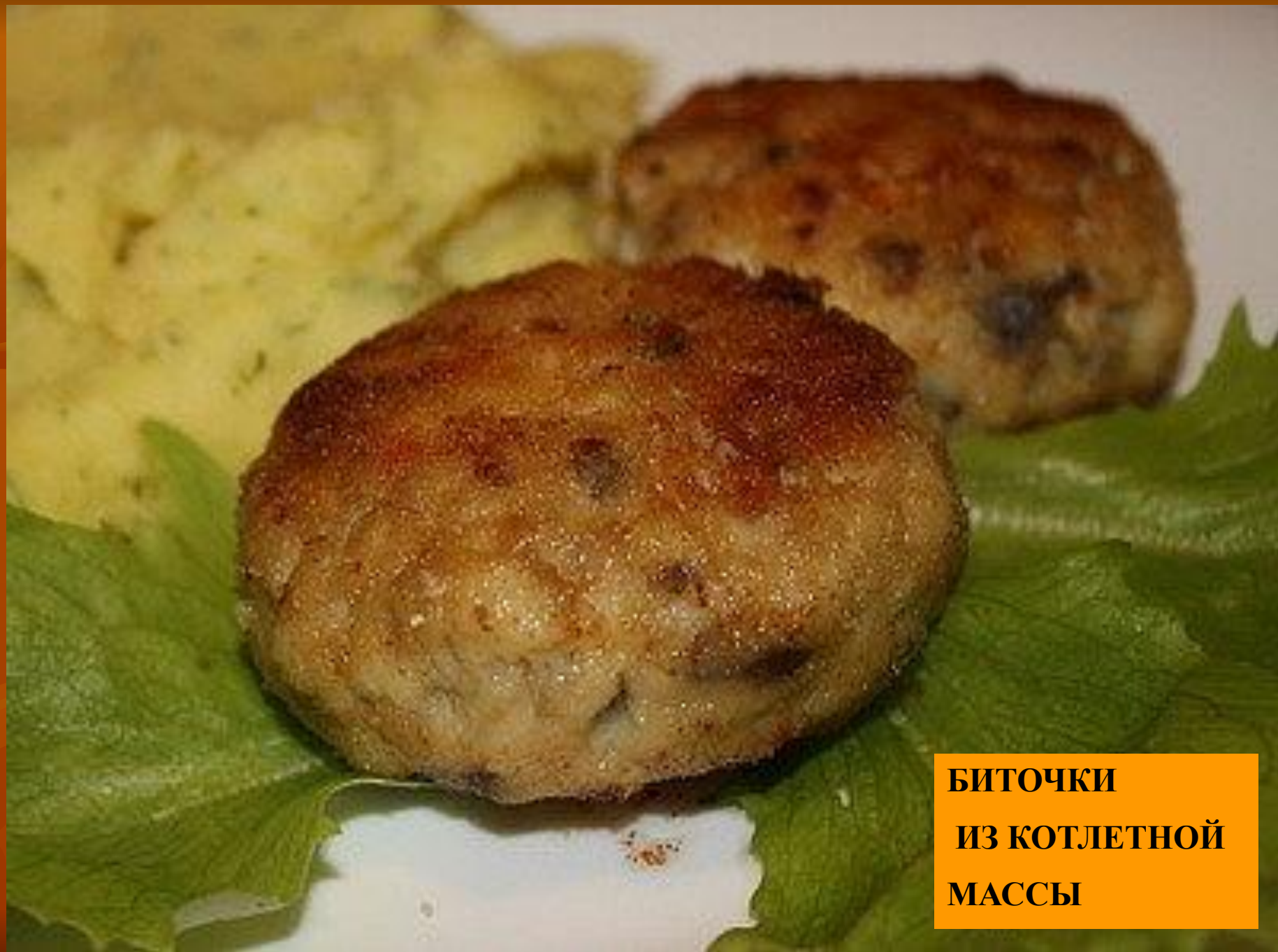
БИТОЧКИ ИЗ КОТЛЕТНОЙ МАССЫ