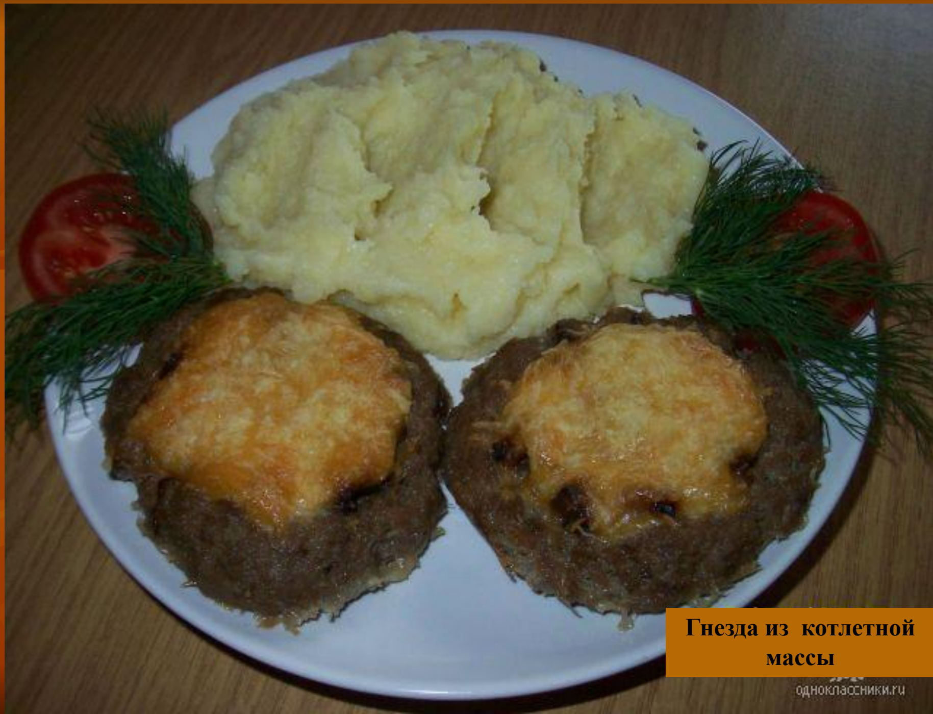
Гнезда из котлетной массы