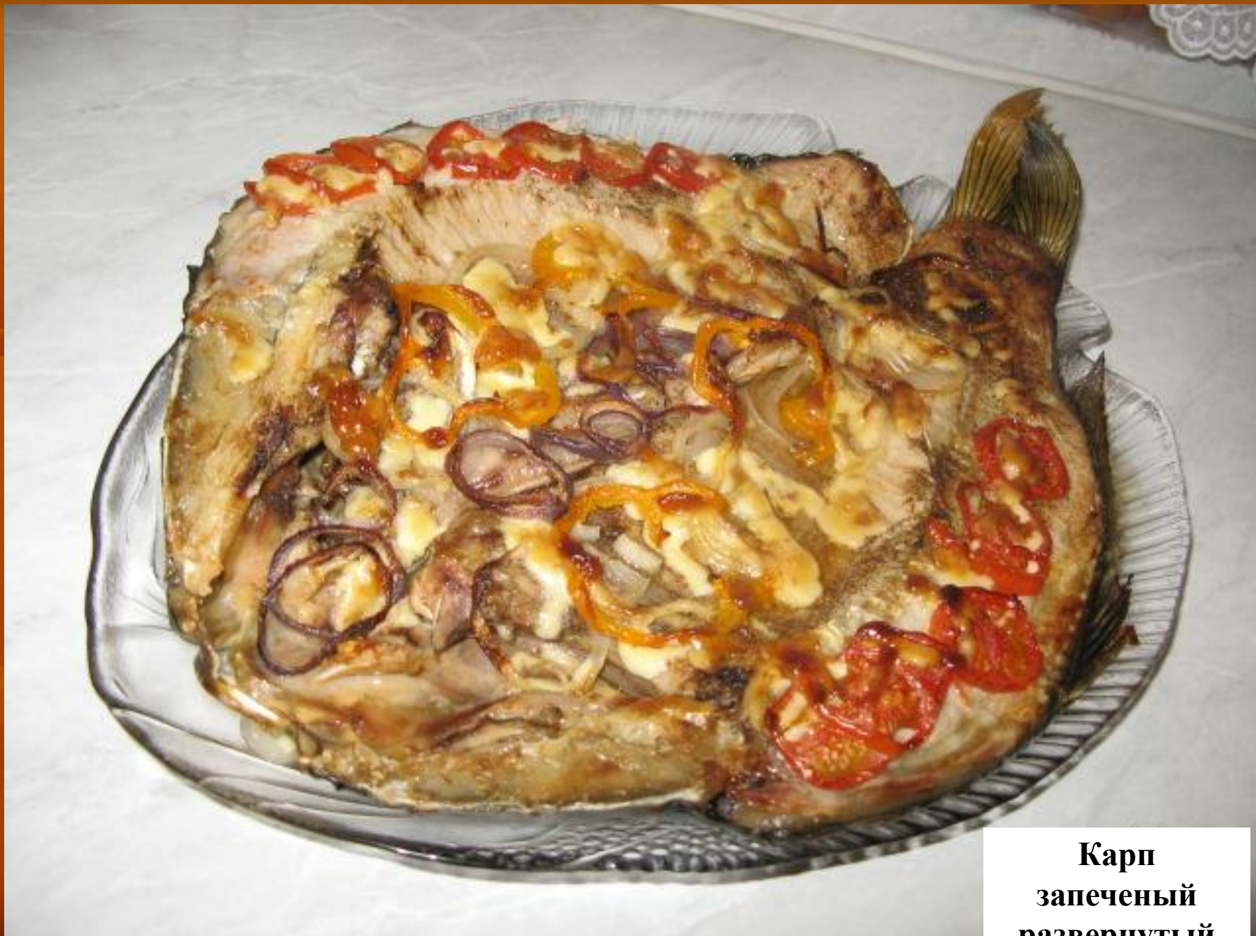
Карп запеченый развернутый