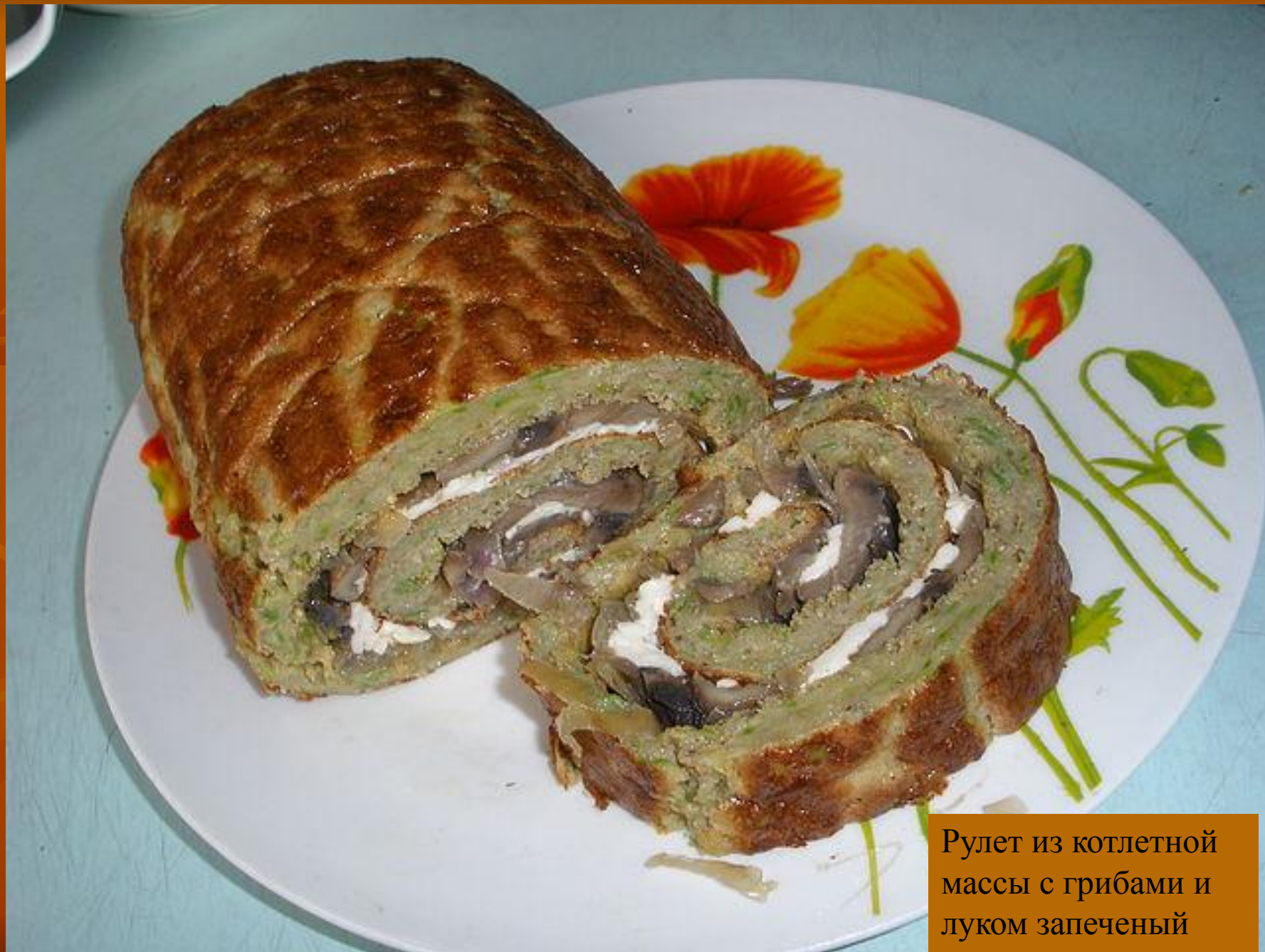
Руллет из котлетной массы с грибами и луком запеченый