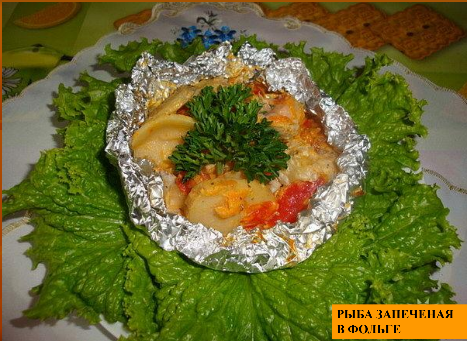
РЫБА ЗАПЕЧЕНАЯ В ФОЛЬГЕ