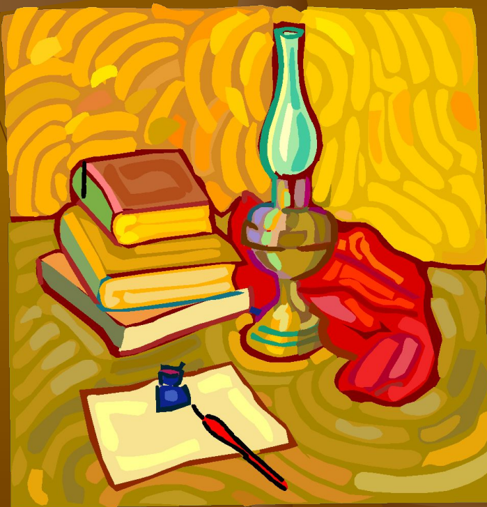
Рисунок для вышивки