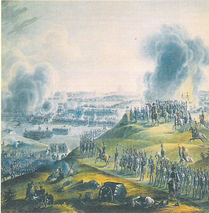
Бородинское сражение. Неизвестный автор. 1812 г.

Все кто видел Михаила Богдановича в славный день Бородино, единодушно отмечали бесстрашие командующего армией. Он появлялся в самых опасных местах сражения в центре кутузовской позиции. Поговаривали даже, что военный министр искал для себя смерти. Четыре лошади пали под ним. Все адъютанты сопровождавшие его, за исключением одного, были убиты или ранены, а генерал оставался неуязвим для ядер, картечи и пуль