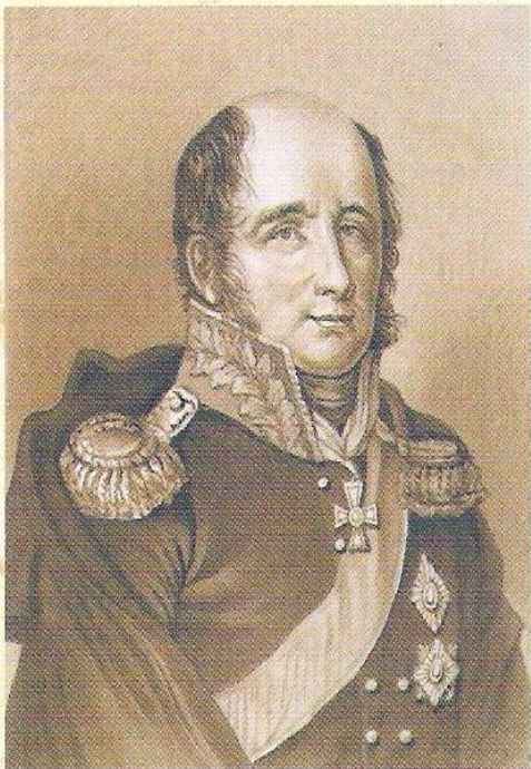
М.Б. Барклай-де-Толли. Гравюра 1820-х гг.

Князь Михаил Богданович Барклай-де-Толли (1761-1818) генерал-фельдмаршал с 1814 года