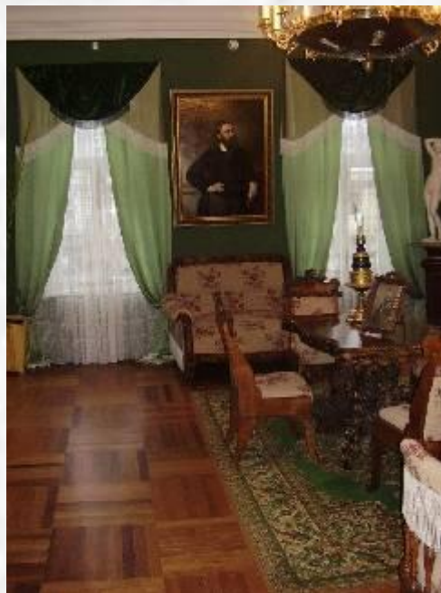
Дом-музей Г. В. Чичерина.