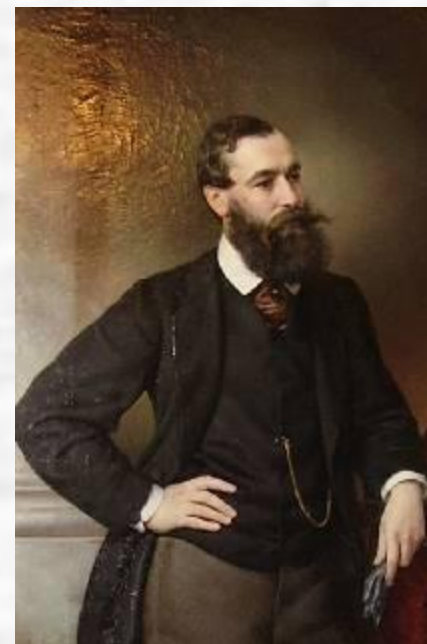
Портрет Б. Н. Чичерина.