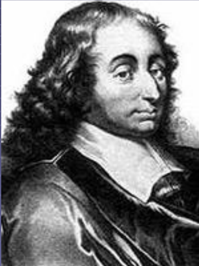
Блез Паскаль (1623 – 1662)