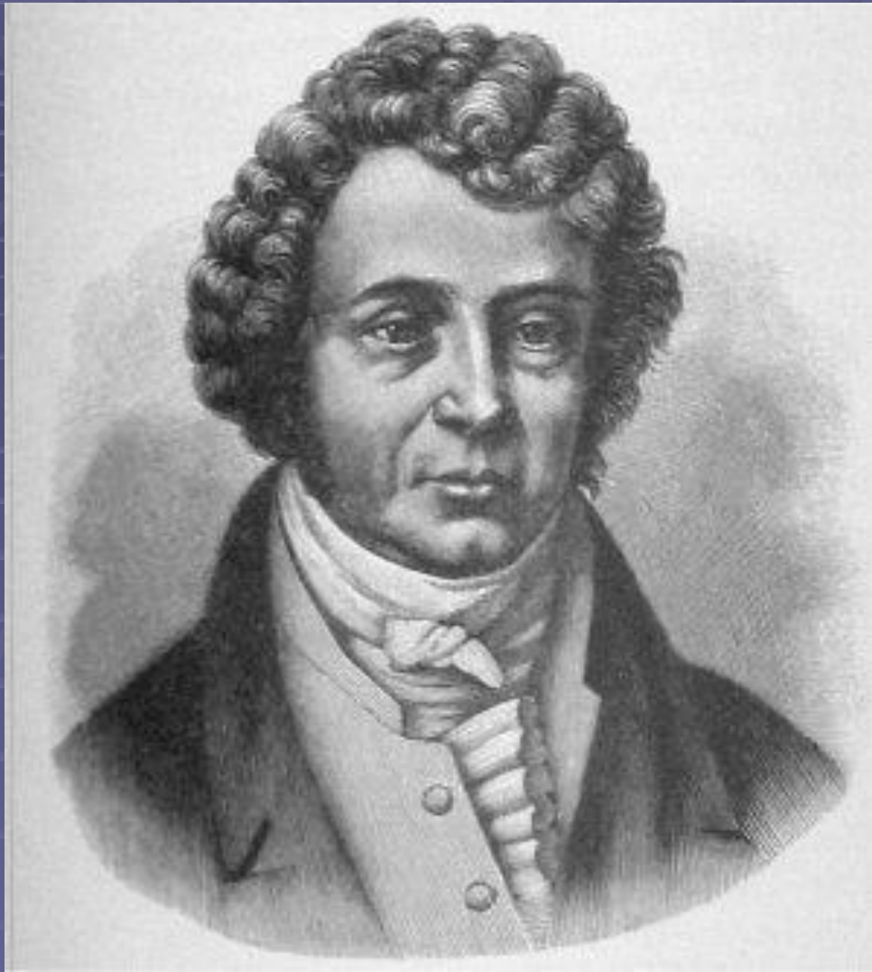
Андре Мари Ампер (1775 - 1836)