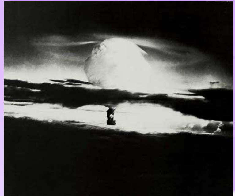
Взрыв атомной бомбы