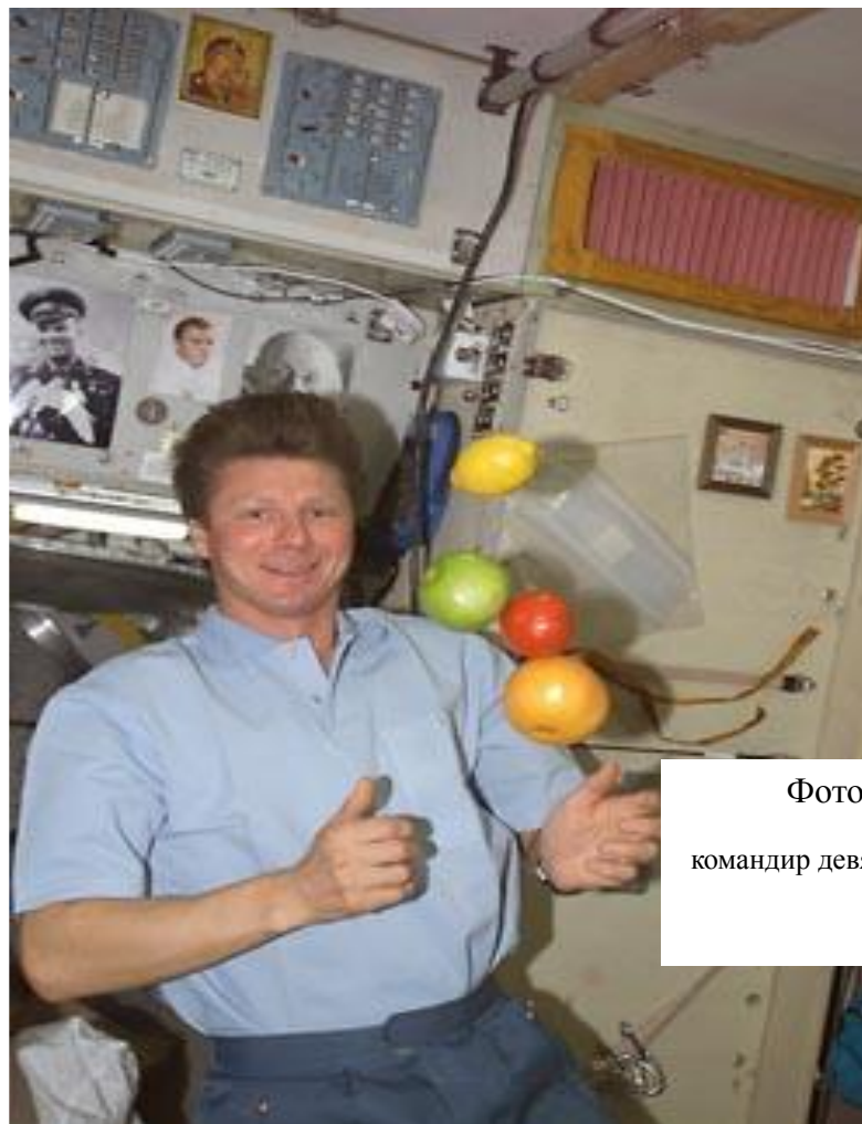
Фото 2 -Геннадий Падалка

командир девятой экспедиции, выбирает фрукт на завтрак