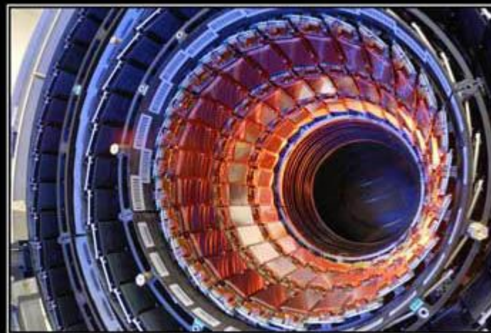
LARGE HADRON COLLIDER

Большой адронный коллайдер на встречных пучках, предназначенный для разгона протонов и тяжёлых ионов и изучения продуктов их соударений. Коллайдер построен в научно-исследовательском центре Европейского совета ядерных исследований, на границе Швейцарии и Франции, недалеко от Женевы. По состоянию на 2008 год БАК является самой крупной экспериментальной установкой в мире. Большим БАК назван из-за своих размеров: длина основного кольца ускорителя составляет 26 659 адронным — из-за того, что он ускоряет адроны, то есть частицы, состоящие из кварков; коллайдером — из-за того, что пучки частиц ускоряются в противоположных направлениях и сталкиваются в специальных местах