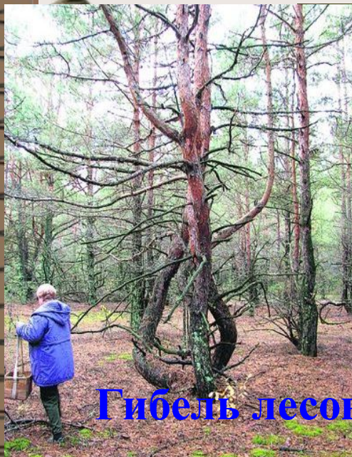
Гибель лесов от радиации