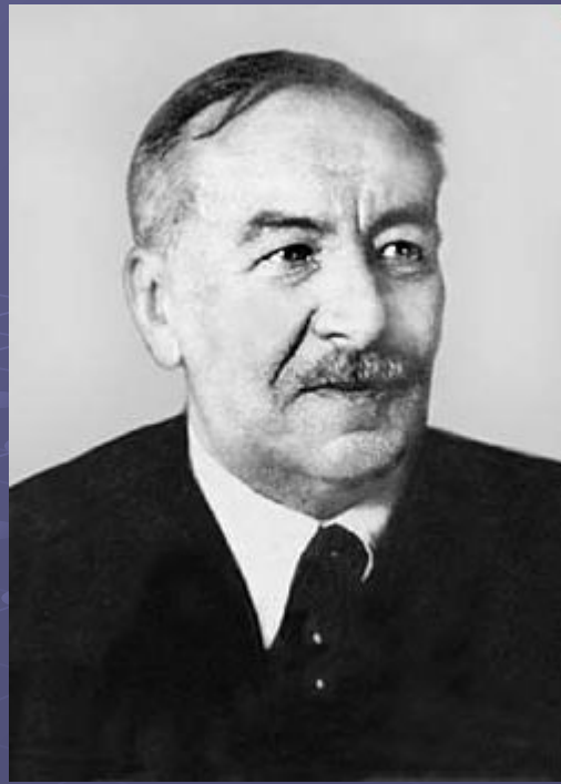
Леонид Исаакович Мандельштам