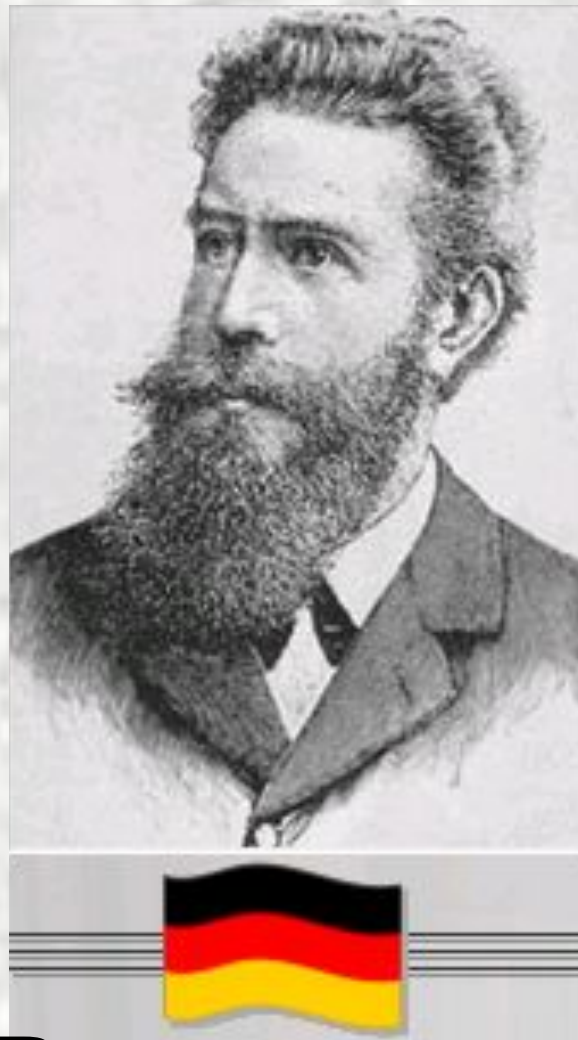
Рентген Вильгельм Конрад (1845-1923гг.)