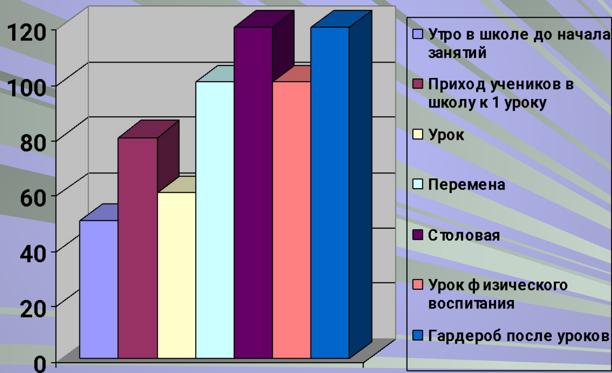
Диаграмма уровня шума одного рабочего дня школы.